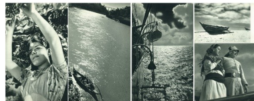
Fig. 7 Fotografias de João Martins, Oporto, (1955)

Em algumas fotografias de João Martins (Fig. 7) encontramos referências visuais modernistas: obliquidades, picados e contrapicados, formas abstratas e até possíveis referências cinematográficas. A justaposição de imagens que se relacionam em tema e espaço, a busca pelo movimento, etc. assim o sugerem e destacam o inovador trabalho deste fotógrafo, entre o dos restantes.