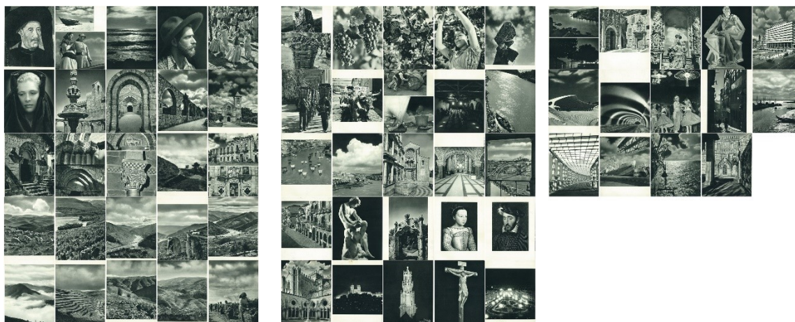
Fig. 5 Apresentação-montagem sequencial das imagens fotográficas de Oporto (1955)

A figura humana, ora em retrato pictórico, ora fotográfico, ora em escultura, vai separando estas secções em que se destacam formas geométricas.