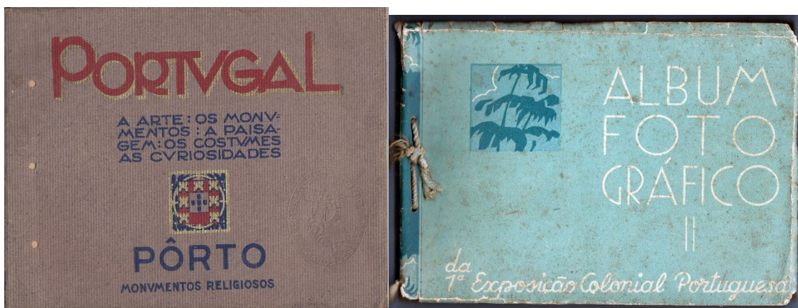
Fig. 1, Portugal (c. 1930) Fig. 2, Álbum Fotográfico (1934)