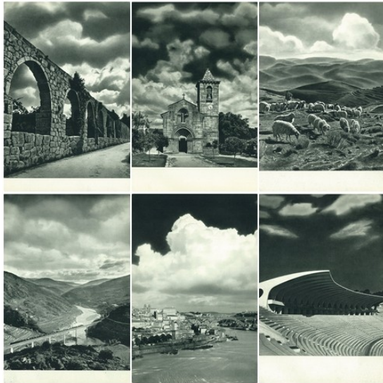
Fig. 6 Céus nas imagens fotográficas de Oporto, (1955)

As manipulações visíveis a olho nu consistem em trabalhos de retoque, acentuação de tons e contraste entre brancos e negros, executadas provavelmente com recurso a tintas gordas, carvão e (ou) grafito e o delineamento das formas, através de lápis. O processo fotomecânico de heliogravura, executado através de uma chapa ou rotativa com matriz impregnada de tinta, criava impressões reticuladas que acentuavam o grão na imagem, assim contribuindo para acentuar o carácter artístico das fotografias.