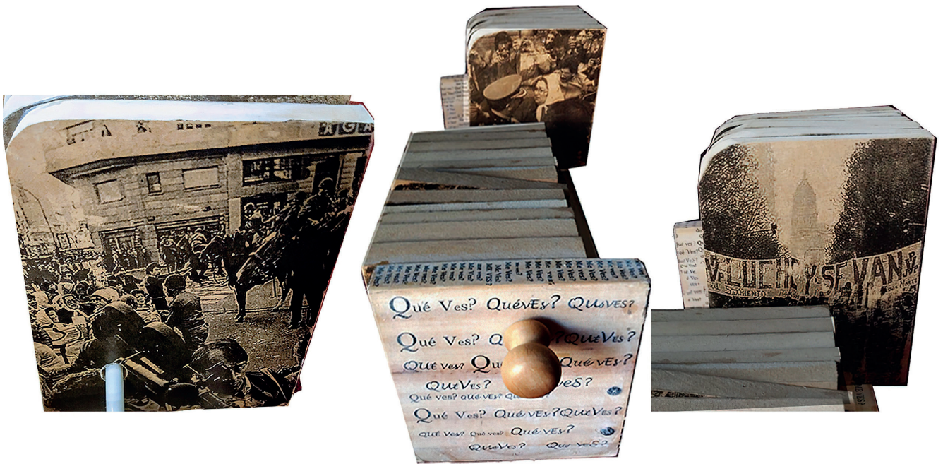
Imagen 8. Obra Tarareando el Estribillo “Mustrario “La plaza de Mayo. Distintos momentos históricos de marchas. (Kirzner,2019)

quien me conoce la reconocerá por sus características, ya que la temática que atraviesa la obra es la identidad, la memoria y atravesado por lo personal, que siempre es político”. (Kirzner, 2019; 41) (Imagen 8)