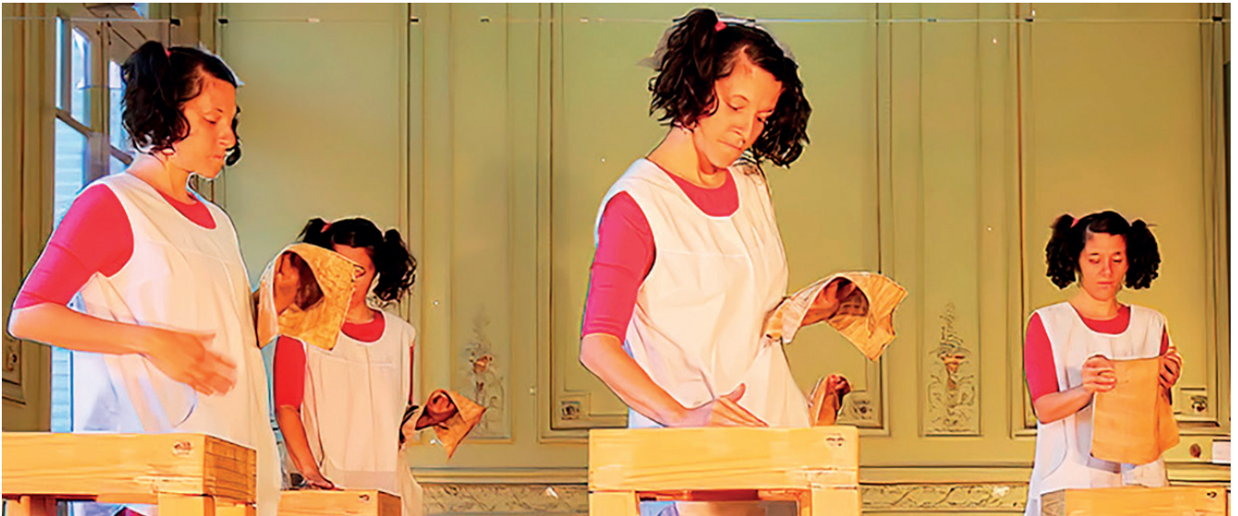
Imagen 4: D'Angelo 2019 Performer marcando la "M". Escrito con Arroz. Captura de pantalla Captura de pantalla.

Referente 5: El Anti Referente La dimensión de la rebelión necesita de un enemigo claro y concreto, que se personifica en Esteban Bullrich, quien siendo ex ministro de Educación de la Nación, Senador Nacional representante del partido de derecha Argentina escribió una "poesía" (en el contexto de la discusión por la sanción de la ley del aborto seguro, legal y gratuito en el congreso de la Nación Argentina): "Mi Mamá no me mimará", Yo te amo mamá como nadie lo hará (...) "mi mamá no me mimará, aunque yo la amaré en su eternidad" (Bullrich, 2018); creando a ese enemigo para la autora.