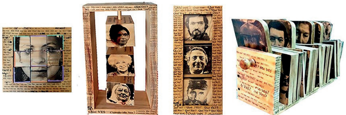
Imagen 6. Foto. Kirzner 2019 obra “Tarareando el estribillo” los 4 libros objetos

bla Klein, lo vivido por la abuela en la guerra, se confunde con lo vivido por la autora en la dictadura militar, lo cíclico aparece históricamente argumentado.