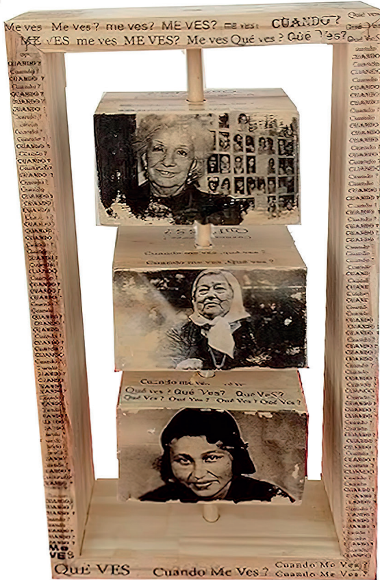
Imagen 7. Obra “Tarareando el Estribillo” “Ellas”. Imagen de Estela de Carlotto, Hebe de Bonafini y la abuela de la autora (Kirzner, 2019)

de mis padres para recaudar fondos en tiempos de dictadura. Lo que más me gustaba era pasar con mi papá por la casa de los artistas a retirar las obras que donaban. De todos los talleres que recorría me fascinaba el de Pujía, lleno de vitrinas a la altura de mis 11 a 14 años, con cantidad de obras en pequeño formato. Mi casa se llenaba de personas y personalidades. Al terminar las jornadas quedaban pocas obras y algunas adquisiciones nuevas que hacían mis padres; se incorporan nuevas esculturas y pinturas a ese cuarto de estar tan grande”. (Kirzner, 2019; 6)