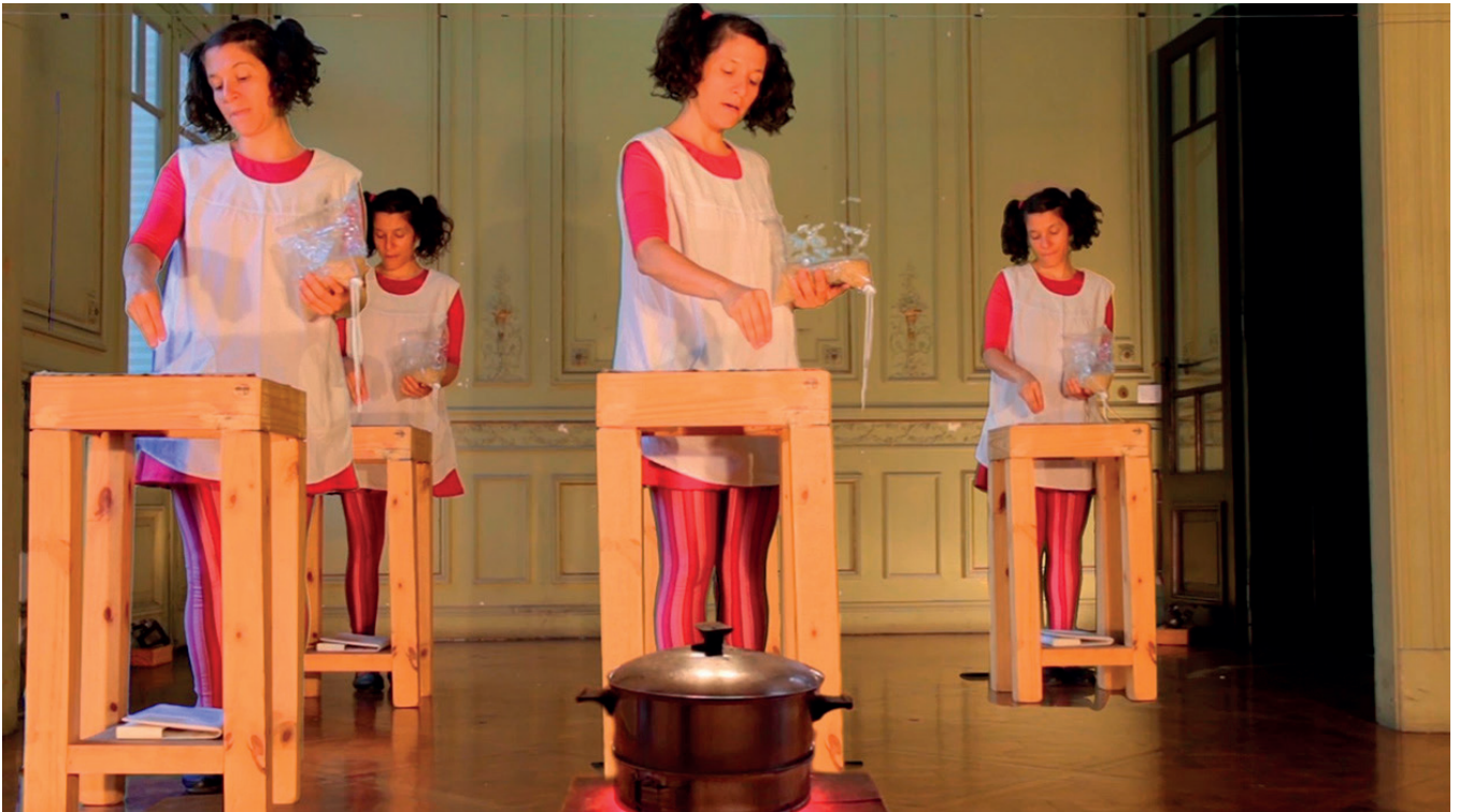
Imagen 2 Obra "Escrito con Arroz" captura de pantalla

cuerpo de obra. Podría dibujarse en una elipse, o un sistema que abarque el UNO. (Aisenberg, 2014:76)