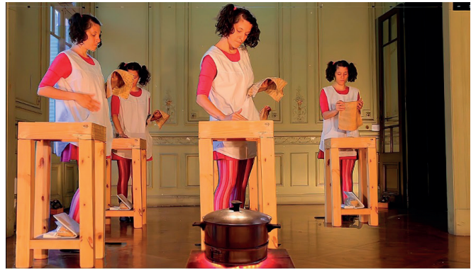
Imagen. 3. Captura de pantalla . D’Angelo (2019) “Escrito con Arroz”. Detalle de organización espacial de la escena infantil.

Referente 1 experiencia fundante: La escena que inunda la obra casi como una constante es la escena infantil que inaugura la performance. Es ambigua la escena, no se sabe si transcurre en un aula o en una cocina, quizás transcurre en todos esos lugares donde nos educamos las mujeres, este referente, la escena infantil, plagada de domesticación y entrenamiento, está del lado de todo aquello de lo que se mofa, con sarcasmo en la obra.