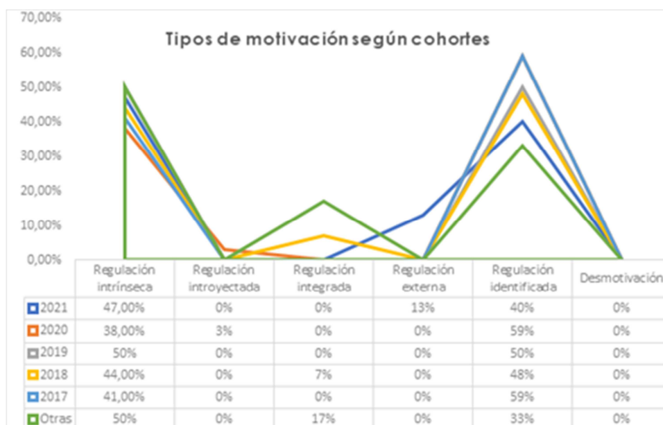
Gráfico 2. Tipo de motivación que predomina al realizar actividad física en los estudiantes de la Carrera de Pedagogía en Educación Física según las cohortes.

Los resultados de la figura 1 también fueron analizados desde la perspectiva de cada cohorte de estudiantes, donde se logró reconocer que en las cohortes otras y 2021 predominó la regulación intrínseca. En las cohortes 2017, 2018 y 2020, predominó la regulación identificada. También destacar que la cohorte 2019 es la única que presentó una distribución igualitaria entre ambas cohortes.