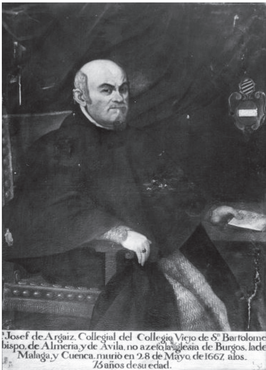
Figura 2. Retrato de José de Argaiz Pérez. Obtenido de: https://www.dipalme.org/Servicios/Anexos/anexosiea.nsf/VAnexos/IEA-IAO-015/$File/IAO-015.pdf (Consulta el 6/10/2021).