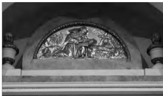
Figura 7: San Antonio Abad. Relieve visible en la parte superior del retablo que actualmente está bajo la advocación de Santa Cecilia.