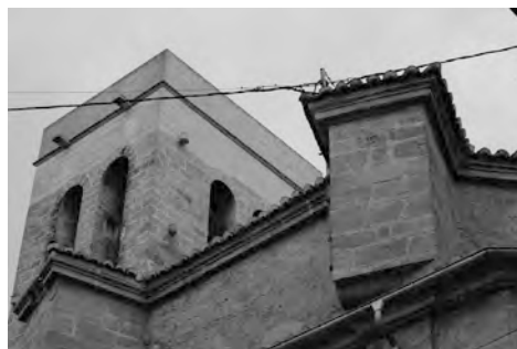
Figura 1: Vista exterior de la cabecera y torre de la iglesia de San Salvador de Valencia.

la urgencia con la que mandó organizar la nueva red parroquial tras conquistar la ciudad de Valencia en 1238. 2 Para ello, se aprovechó la anterior estructura de mezquitas. De esta manera el nuevo monarca contó con una ramificación a través de la cual llegaban nuevas costumbres a todo el reino en general, y a la ciudad en particular. 3