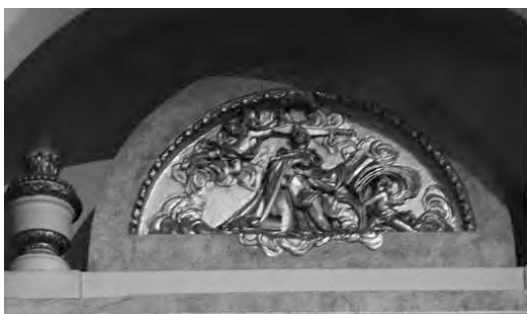
Figura 6: San Pedro Mártir. Relieve en la parte superior del retablo dedicado hoy día a la Virgen de los Buenos Libros.

el retablo estaba sin pintar, y que solo tenía la imagen del dicho santo, y el pie de aquel estaba sin ara, sin frontal, medio caydo, y sin cosa de adorno, y la lossa de la boca del carnero rompida. 55