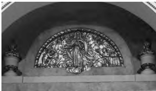
Figura 8: Inmaculada Concepción. Relieve parte superior del retablo que alberga hoy día la figura de Nuestra Señora de los Dolores.

quien tenía derecho de sepultura, los mandatos registrados en la Visita, como era masillar el pie del altar y poner ara fija en él.