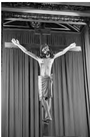
Figura 2: Santísimo Cristo del Salvador. Talla medieval. Preside el retablo mayor de la iglesia.

La fuerza artística del Cristo románico, cuyas características lo hacen único ya no solo en nuestro ámbito territorial, si no en el de toda España, ha despertado la curiosidad y el anhelo por investigar y conocer su procedencia. Estudios brillantes y recientes como el de Luis Arciniega, centrado en la divulgación de la Passio Imaginis 8 en la Corona de Aragón y su repercusión entre religiones monoteístas; o el de José F. Ballester-Olmos y Anguís, 9 gran conocedor del antiquísimo crucifijo, ponen en relieve la importancia de la imagen en el contexto histórico y devocional valenciano.