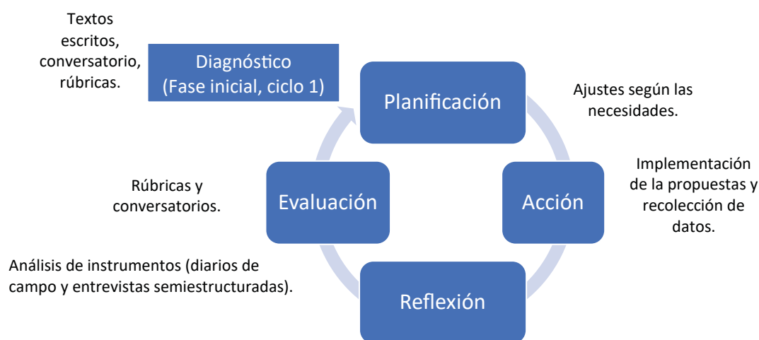
Figura 1. Ciclo y fases de la investigación-acción

Se llevaron a cabo tres ciclos al trabajar las tres unidades didácticas, además de una unidad introductoria con la que se hizo el diagnóstico. Las fases se repitieron en cada ciclo, lo que permitió ajustes a la propuesta. La fase de planificación se dio con base en un programa prediseñado y en las entrevistas semiestructuradas grupales que se hicieron al finalizar cada unidad didáctica, así que se hicieron tres entrevistas. En la fase de acción, se trabajó con el material diseñado. En la fase de reflexión y evaluación se revisaron los instrumentos: los diarios de campo y las entrevistas semiestructuradas.