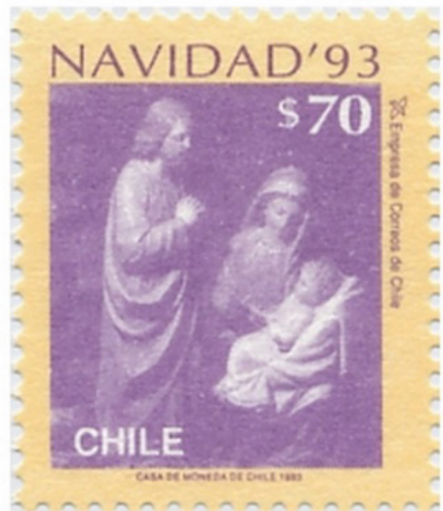
Imagen 1: Navidad 1993

hasta la actualidad; no siempre ha implicado una garantía de que se incorpore en la iconografía la representación de una mujer o de la Virgen, como sucedió en 1975, donde se muestra a un ángel o en 1985 donde aparece un bebé en un pesebre.