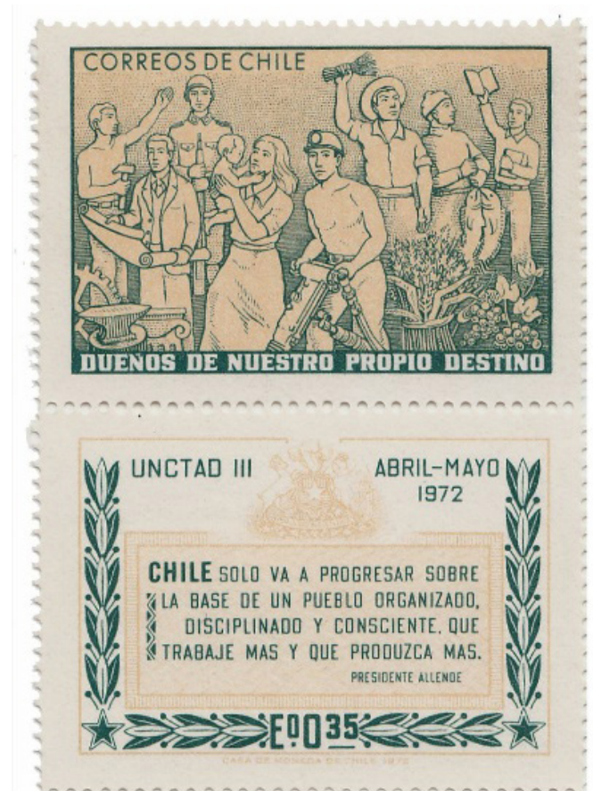
Imagen 3: Dueños de nuestro propio destino (1972)

En la línea de lo ya planteado, observamos como la figura femenina aparece, en los sellos postales emitidos por el Estado chileno entre 1964 y 1995, sujeta nuevamente a un rol tradicional, en este caso el de educadora.