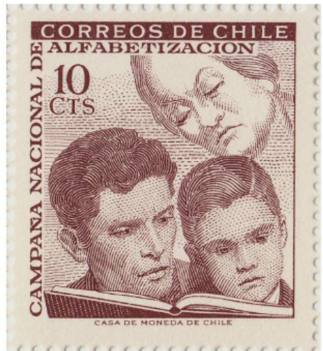
Imagen 2: Campaña nacional de alfabetización (1966)