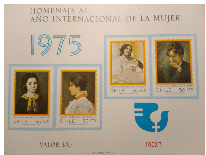
Imagen 4: Block Souvenir homenaje al año internacional de la mujer (1975)

Por ende, no resulta extraño encontrar que un discurso político que resalte la independencia y el aporte que cada ciudadana/o realizaba al país, se de a la mujer en un rol propio de la cultura patriarcal de la época. Con la dictadura militar se resalta nuevamente una imagen de la mujer recatada y de madre, como podemos observar a continuación.