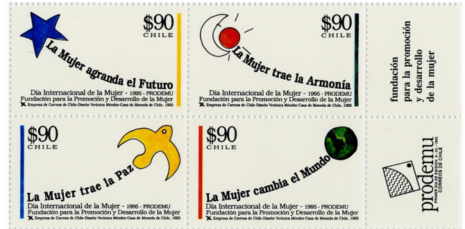
Imagen 6: Día internacional de la mujer (1995)

No ocurre lo mismo con la representación de otras etnias del país como la mapuche, lo que probablemente se relacione con que a través de los sellos postales también se promocionaban lugares que visitar para fomentar el turismo, donde la de Isla de Pascua aparece como un destino atrayente y exótico.