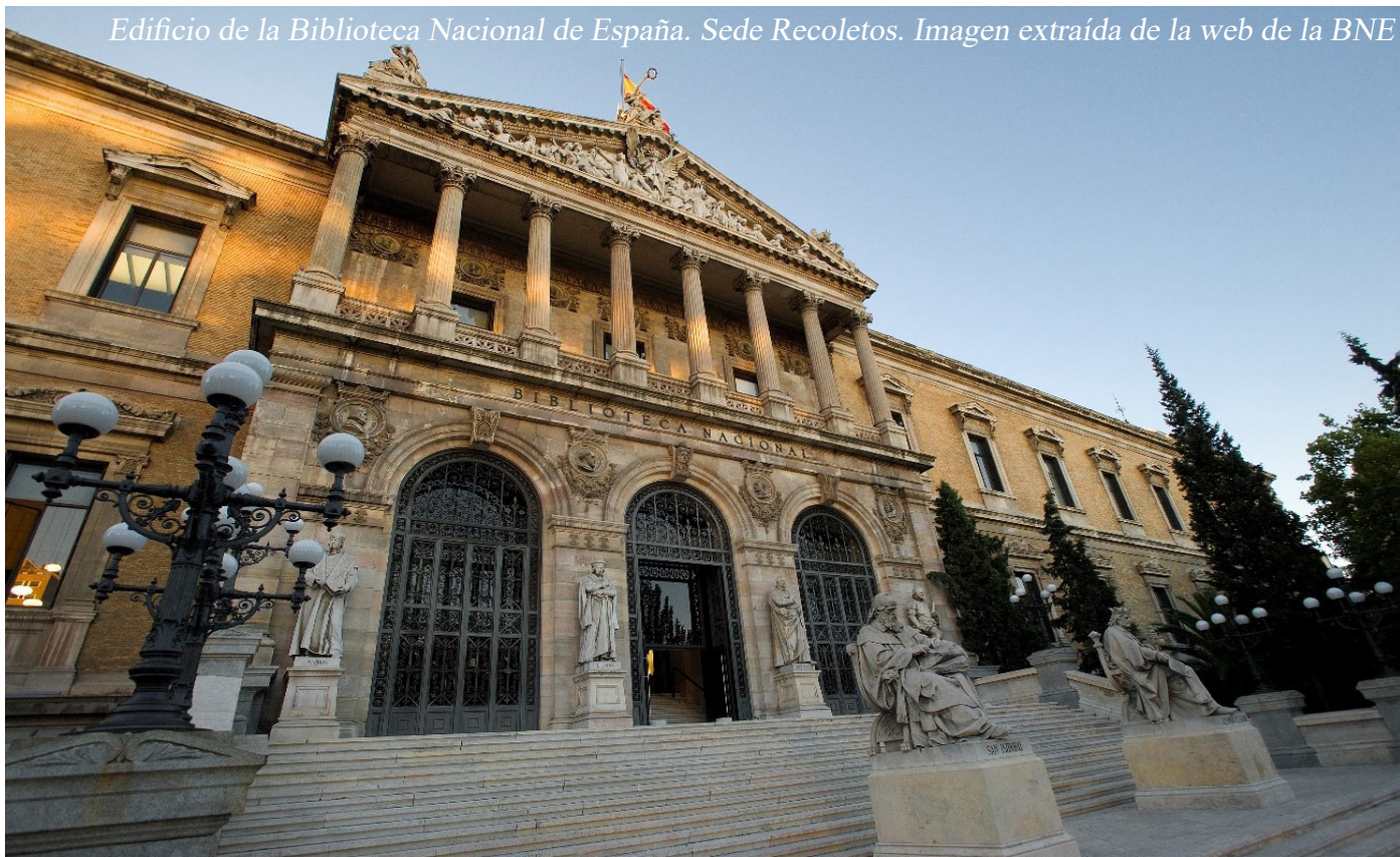
Edificio de la Biblioteca Nacional de España. Sede Recoletos.

para la construcción del relato de la experiencia concentracionaria en Argentina”, Rev. Sociedad & Equidad N° 4, julio de 2012, pp. 133-152) en el que definió muy bien este término al decir que la memoria sonora es «la construcción a la que cada uno recurre para significar los sonidos que percibe, excediendo el hecho físico y otorgándole un valor semántico en función de la experiencia socio-cultural personal». En este caso, la BNE no sólo nos da a conocer sus tesoros, sino que, además, lo hace empleando un medio sonoro que nos recuerda la importancia de la tradición oral, gracias a lo cual, antiguamente, los pueblos transmitían los conocimientos de generación en generación, haciendo posible su durabilidad.