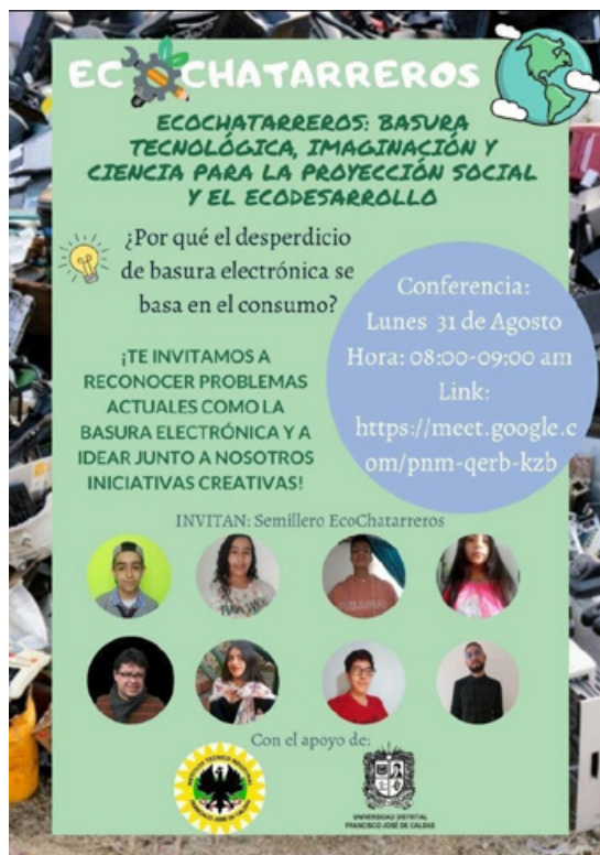
Figura 4. Volante publicitario.