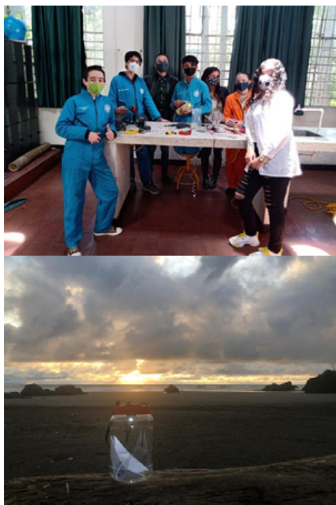
Figura 5. Proyecto Luces de paz: estudiantes del semillero realizando las lámparas y entrega de las lámparas por parte de la ONG Agencia Social.

Esta fue una oportunidad de afianzar las relaciones sociales al interior del semillero, en donde afloraron los sentires y la carga afectiva (Quintar, 2008) de los participantes. Aspectos fundamentales para el proceso pedagógico, que permitieron afianzar relaciones de amistad y empatía entre docentes y estudiantes alrededor del trabajo manual de la fabricación de lámparas. El proyecto “Luces de Paz” llegó a los municipios de Nuquí y Bahía Solano, Chocó, en especial a sus niños (Figura 5).