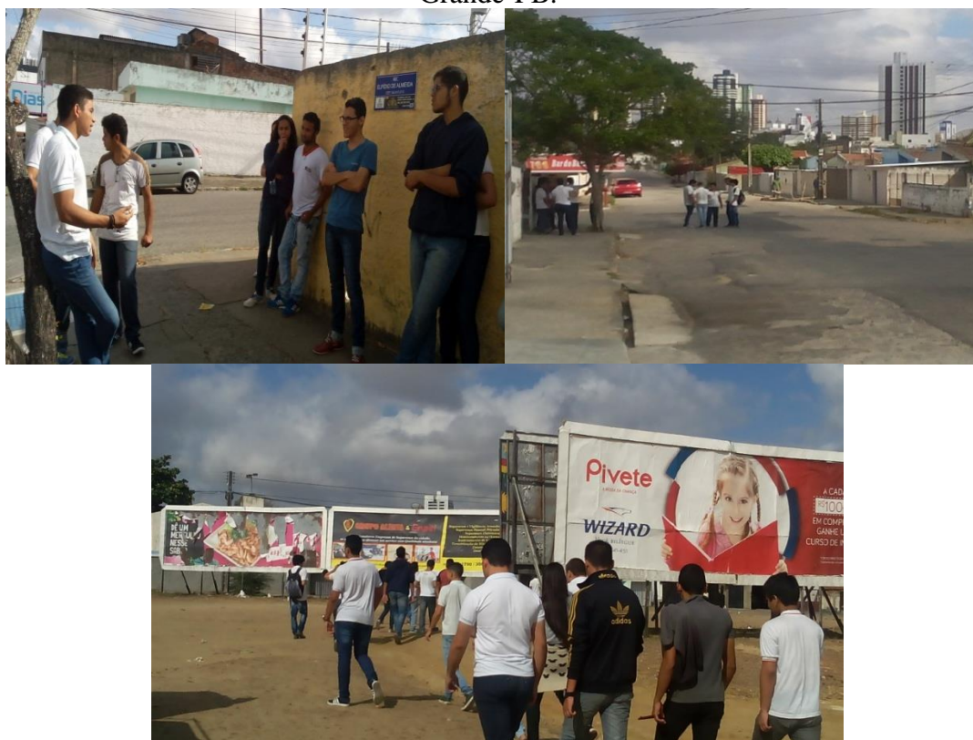
Figura 2 - Aula de campo sobre a violência urbana no bairro do Catolé, Campina Grande-PB.