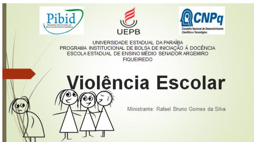
Figura 3 - Slide da palestra sobre violência urbana desenvolvida em turmas do 3º ano do Ensino Médio da Escola Estadual Senador Argemiro de Figueiredo.