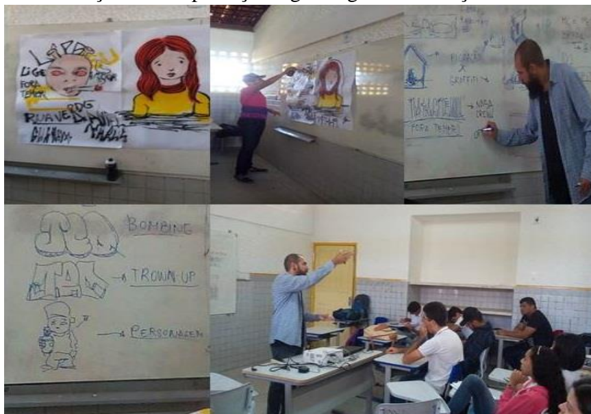
Figura 04: Intervenções sobre pichação e grafiteagem: diferenças sociais e ideológicas.