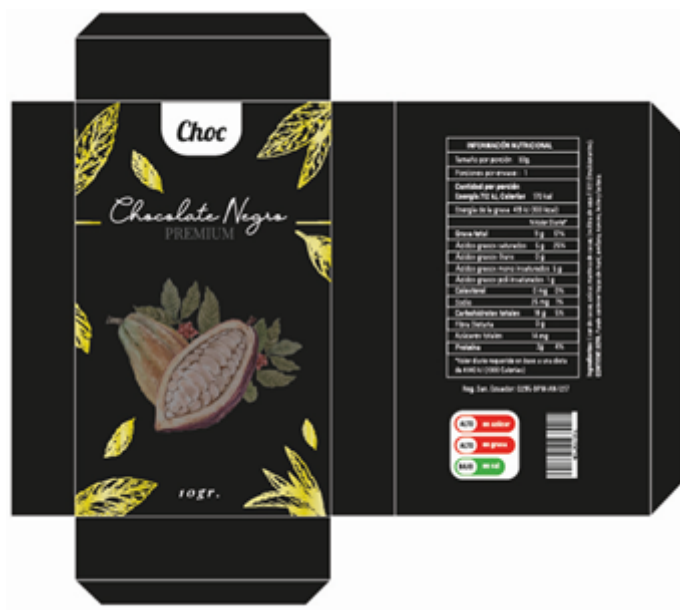
Diseño de packaging concepto premium