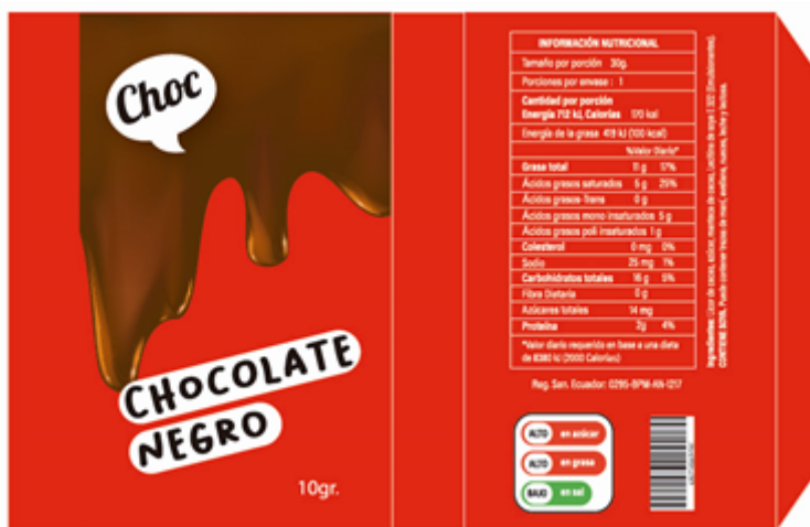
Diseño de packaging concepto estándar