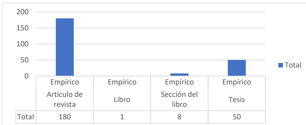
Figura 2. Tipos de estudio publicados

La totalidad de publicaciones fueron estudios empíricos, y considerando que en los criterios de inclusión se tuvieron en cuenta artículos de revisión, en tanto respondieron a documentos que implementaron metodologías de investigación bibliométrica o revisiones sistemáticas de literatura, y que fueron publicados en revistas especializadas o fueron investigaciones para aspirar a títulos universitarios o postgraduales (figura 2).