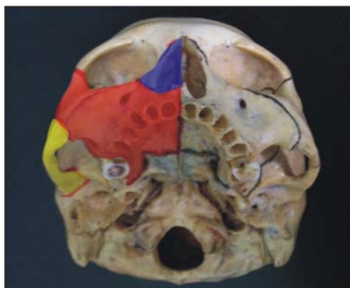
Figura 3. Complejo naso-maxilar (color azul), complejo máxilo-malar (color rojo) y complejo témporo-malar (color amarillo).