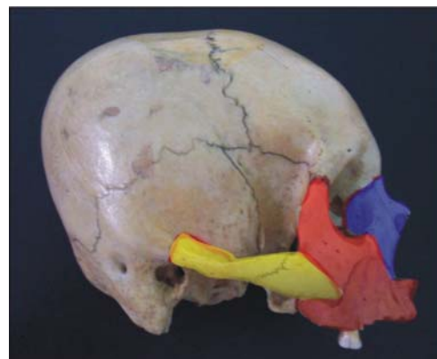
Figura 2. Complejo naso-maxilar (color azul), complejo máxilo-malar (color rojo) y complejo témporo-malar (color amarillo).