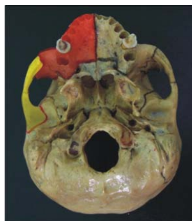
Figura 4. Complejo máxilo-malar (color rojo) y complejo témporo-malar (color amarillo).