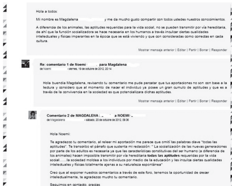
Figura 5. Intercambio entre dos alumnas sobre la función socializadora de las aptitudes

del fenómeno del desarrollo moral. De manera análoga, reconocer al conocimiento como una conversación implica aceptar que el conocimiento tiene autores e historia, que no es impersonal ni atemporal (Carlino, 2003; Fernández-Cárdenas y Piña-Gómez, 2014). En seguida, presentamos la ilustración de los intercambios de un par de estudiantes en la plataforma del curso que han revisado un texto sobre la postura de Durkheim (Di Pietro, 2004) con relación a la función socializadora hacia las aptitudes de las personas en la construcción del orden social. Las preguntas que nos hicimos en este estudio (Reyes y Fernández-Cárdenas, en revisión) sobre los docentes incluyen las siguientes: ¿cómo se insertan los participantes en la conversación?, ¿a quién interpelan?, ¿cómo lo hacen?