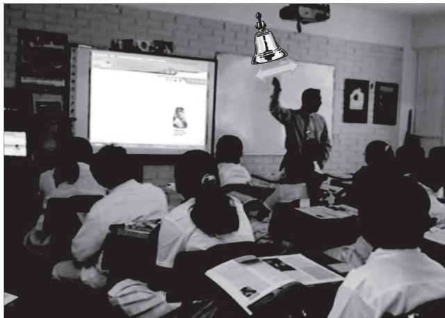
Figura 1. Docente gesticula el toque de campana y lanzamiento de cohetes en la celebración de la independencia de México.

En la interacción se aprecia el esfuerzo del docente por secuencialmente orquestar (Jewitt & Kress, 2003) todos los diferentes recursos semióticos para socializar a sus alumnos en conocimiento histórico; en particular, sugerimos que la práctica educativa mediada por el uso de pizarrones electrónicos incluye gestos como la principal estrategia para organizar secuencialmente el habla en interacción con los recursos electrónicos desplegados en la pantalla para la participación de los alumnos como un todo coherente. Con esto, destacamos que los participantes intencionalmente utilizan su cuerpo y manos para afirmar aspectos de lo que está ocurriendo en la situación comunicativa.