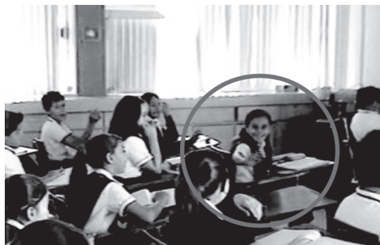
Figura 4. Niña saludando a silla vacía con el “niño transparente”.