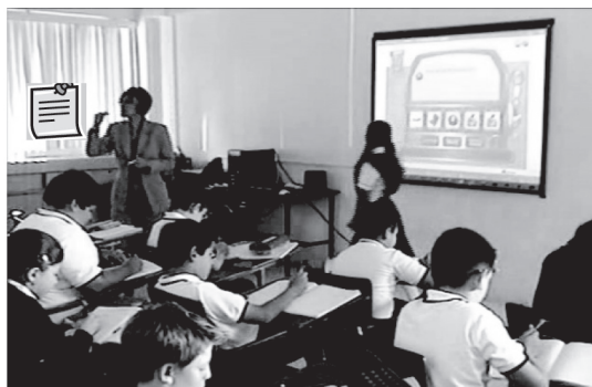
Figura 3. Maestra señalando las partes del cuento.

Por último, es relevante notar de nuevo la presencia de elementos gestuales en la manera en que se construye este sentido de pluralidad imbuido de fantasía. Primero, por el señalamiento de la maestra con sus manos de las partes del cuento, y segundo, por el modo en que la niña saluda a la silla vacía en el turno 6, y parodia la existencia de un niño transparente, como respuesta al espíritu de fantasía y sarcasmo establecido por la maestra previamente.