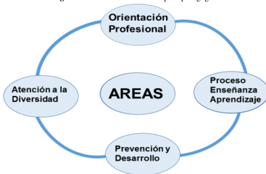
Figura 1: Áreas de la orientación psicopedagógica

Para el desarrollo del proceso de orientación se considera que abarquen las áreas temáticas que se interrelacionan de manera mutua y se expresan en el siguiente diagrama.