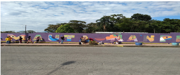
Figura 5. Actividad artística realizada como parte del procedimiento de pintura mural.

Finalmente, el trabajo de arte urbano a través de un PAE, es una metodología adecuada y recomendada para el desarrollo de los procesos de sostenibilidad del entorno socio-cultural del kichwa en diferentes contextos, dado el alto nivel de contenidos curriculares EIB que se pueden llegar a desarrollar a través del trabajo con ABP; pues las actividades artísticas desarrolladas como el trabajo de pintura mural, contribuyen de forma significativa al proceso de fortalecimiento cultural; aportando recursos creativos y pedagógicos para la valoración de prácticas y saberes de la lengua y la cultura, dentro y fuera del aula.