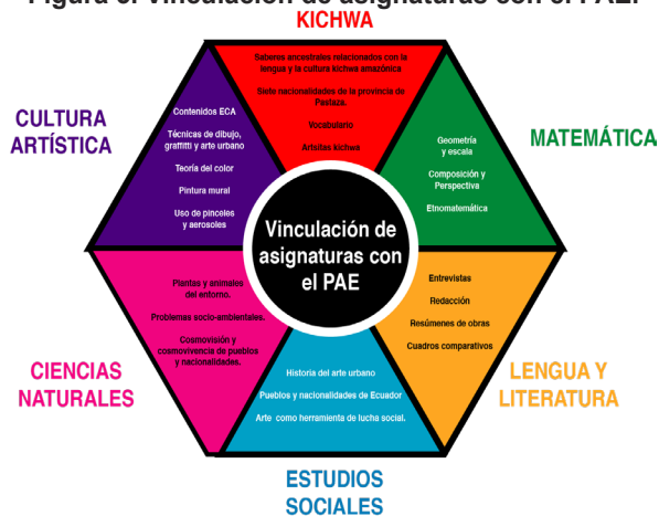
Figura 5. Vinculación de asignaturas con el PAE.

El producto final del PAE fue un mural artístico, cuyo diseño y montaje fue resultado de un trabajo colaborativo de valoración iconográfica de elementos significativos del contexto amazónico, cuya funcionalidad didáctica genera beneficios a favor de la sostenibilidad de la cultura kichwa. Dicha funcionalidad no se limita a su elaboración, pues sus posibilidades pedagógicas incluyen también una gran pizarra didáctica para el reconocimiento y enseñanza de saberes y prácticas relacionadas al entorno cultural y educativo; exteriorizando los escenarios de aprendizaje al contexto comunitario, creando vínculos de relación social y diálogo intercultural como establecen las políticas del MOSEIB.