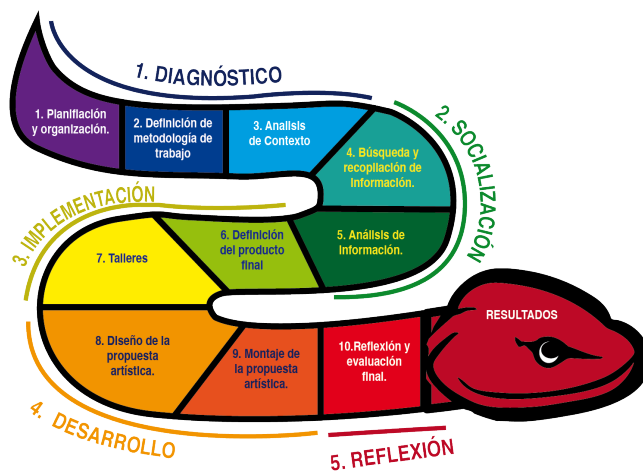
Figura 3. Plan de intervención del Proyecto Artístico Escolar

Bajo esta premisa del aprender haciendo, se planteó también la evaluación del PAE, el cual se dio de forma procesual y continua a las diferentes clases y actividades desarrolladas a través de las diferentes técnicas y recursos aplicados como la IAP, la observación participante, los dispositivos interculturales y el Art Thinking.