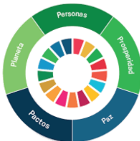
Figura No. 1. Esferas de desarrollo sostenible