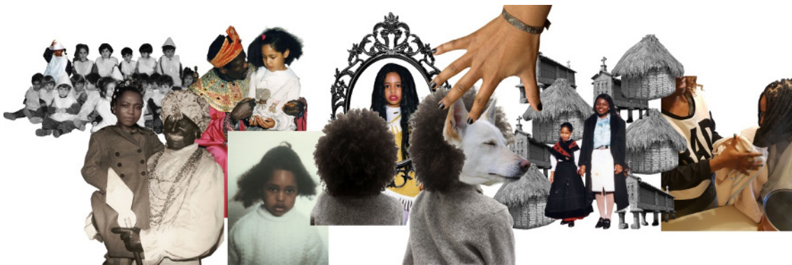
Figura 7: Collage con algunos de los recuerdos visuales recreados.

A través de una introspección y por medio de instrumentos de investigación como la fotografía, el vídeo o el collage, recreo y comparto partes de mi historia con un enorme poder emocional y visual; vivencias supuestamente aisladas que surgen cada vez que me pienso en relación al resto (López-Ganet y Mesías-Lema, 2021). Podríamos llamarlas autobiografías espontáneas por ser elaboradas sin una guía previa y aparecer sin seguir un orden claro y justificado. Sin embargo, estos recuerdos cuando se juntan hablan de esa necesidad de contar de forma casi involuntaria; es una necesidad de liberarme, de vaciar unos sentimientos que emanan ante una realidad que no puedo controlar (ver Figura 7).