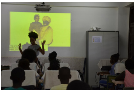
Figura 12: Puesta en práctica en el Colegio Español de Ela Nguema (Malabo, Guinea Ecuatorial) .

Mi realidad pasó a ir a la par con otras realidades; mi presencia en el aula adquiriría distintos significados según el contexto: de profesora negra en un contexto blanco, pasé a ser un espejo en el que verse reflejados por haber vivido situaciones similares y sentirse identificados en el caso de las aulas canadienses o de la experiencia con Afrogalegas (ver Figuras 12 y 13). En esa posición de otredad que caracteriza el punto de partida del trabajo, nos une algo más que la identidad que nos obsesiona. Escribimos “desde” en lugar de “sobre.” La historia y sus conexiones con la nuestra propia nos permiten ver los episodios de dolor, incomodidad y duda desde otra perspectiva que nos posiciona y nos ayuda a avanzar.