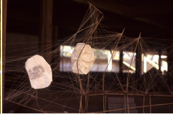
Figura 11 (derecha): Aracnes . Fuente: Rosana Paulino. Imágenes transferidas sobre tela e hilo de poliéster. Dimensión aproximada: 12 m. https://www.rosanapaulino.com.br/