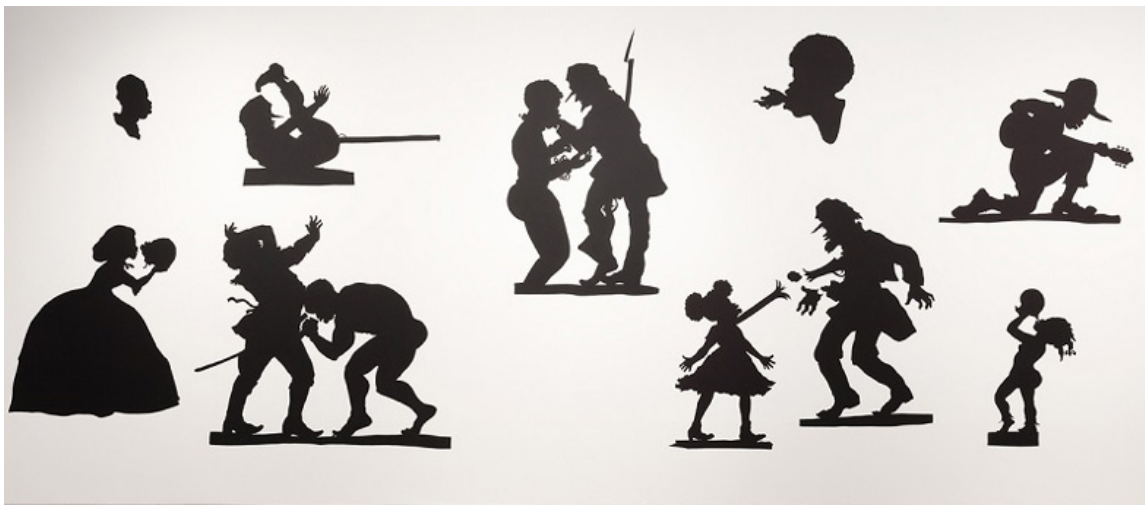
Figura 3: My complement, My Enemy, My Oppressor, My love . Fuente: Kara Walker (2007). http://lebastart.com/2020/06/negro-sobre-blanco-el-devenir-negro-del-mundo/