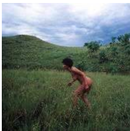
Figura 5: Venus Baartman. Fuente: Tracey Rose (2001). Fotografía en color sobre papel. 120 x 120 cm. Tate, Londres, UK. https://www.tate.org.uk/whats-on/tate-liverpool/exhibition/afro-modern-journeys-through-black-atlantic/afro-modern-room-6

El imaginario anterior a la época colonial y esclavista era completamente diferente al heredado desde entonces. Las personas africanas fuimos altamente consideradas desde la antigüedad clásica hasta el Renacimiento (Knight, 2019). Las imágenes cuentan la historia. Y es que, según Farrington (2005), desde la opresión blanca se crearon y utilizaron imágenes distorsionadas para contar historias sobre las personas negras y la experiencia negra en la diáspora. Mediante esa imagen negativa, exótica, hipersexualizada, salvaje e inhumana, se