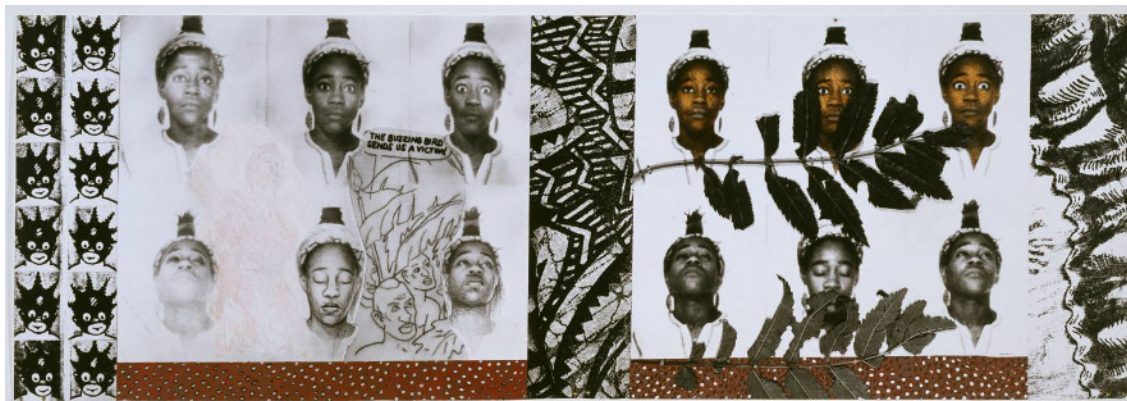
Figura 4: From Tarzan to Rambo: English Born 'Native' Considers her Relationship to the Constructed/Self Image and her Roots in Reconstruction . Fuente: Sonia Boyce (1987). Técnica mixta y fotografía sobre papel. 124 x 359 cm. Tate, Londres, UK. https://www.tate.org.uk/art/artworks/boyce-from-tarzan-to-rambo-english-born-native-considers-her-relationship-to-the-t05021

DOI: https://dx.doi.org/10.17561/rtc.21.6471 Investigación