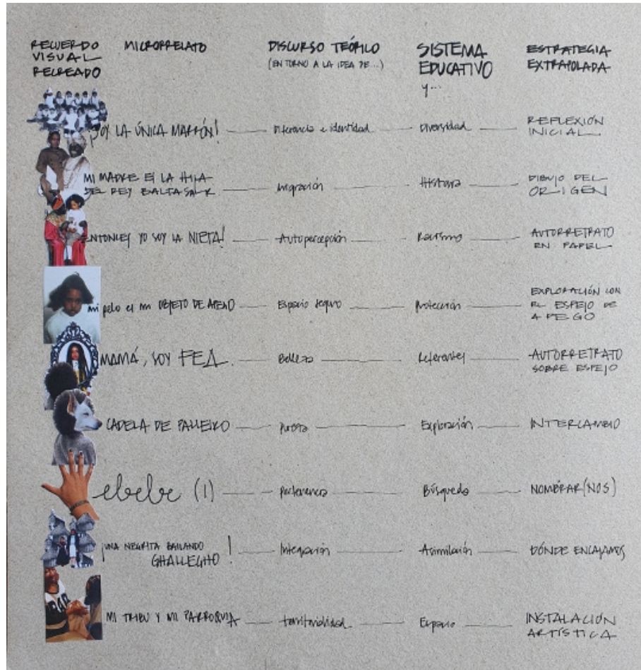
Figura 8: Esquema del proceso investigador.

DOI: https://dx.doi.org/10.17561/rtc.21.6471 Investigación