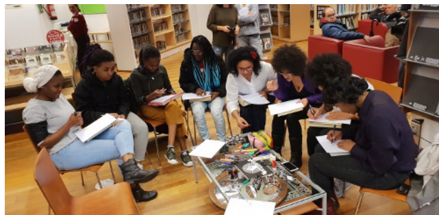
Figura 13: Puesta en práctica con Afrogalegas (A Coruña) . Fuente: López-Ganet (2018)