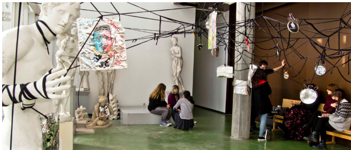
Figura 9: Puesta en práctica en la EASD Pablo Picasso (A Coruña) .

La instalación es un elemento que marca un principio de extrañeza; algo que puede contradecir la naturaleza del lugar. Se apropia de él y este se integra en la obra. El soporte de la obra es el espacio mismo. Enredada en los temas que la atraviesan—que siento muy próximos a los míos—, la obra de la artista visual educadora y curadora Rosana Paulino (São Paulo, 1967), reflexiona acerca de la condición de los cuerpos negros en la sociedad brasileña, preocupándose por cómo la imagen opera en la formación de prejuicios sobre la población negra (Sardelich, 2020). De toda la obra de la artista brasileña, me interesó especialmente el papel del hilo: cómo conecta elementos y vidas y recrea historias en el espacio (ver Figuras 10 y 11). Así me imaginé las instalaciones artísticas de la puesta en práctica, como un momento de encuentro e intercambio del trabajo individual narrado en los espejos; reflexiones personales y privadas materializadas en forma de autorretratos que ganaban presencia en un espacio que no siempre se sentía como propio o seguro.