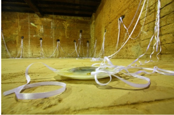
Figura 10 (izquierda): As Amas . Fuente: Rosana Paulino (2009). Parafina, cinta de raso, imagen digital y flores. Dimensiones variables. https://www.rosanapaulino.com.br/

DOI: https://dx.doi.org/10.17561/rtc.21.6471 Investigación