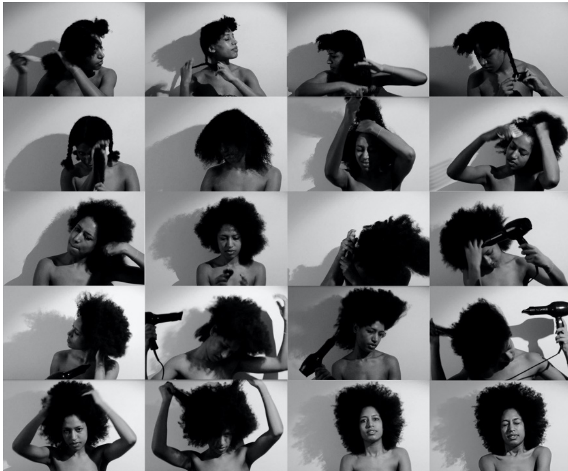
Figura 1: Fotogramas del video Así peinaba, así, así . Fuente: López-Ganet (2016). https://www.youtube.com/watch?v=leVdWV1AduQ

DOI: https://dx.doi.org/10.17561/rtc.21.6471 Investigación