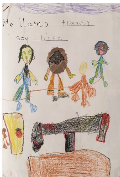
Figura 2: Dibujo de la clase de 3 años.

que nos podemos encontrar a la hora de llevar a cabo investigaciones sobre nosotras como mujeres negras —pero también al adentrarse en cualquier otra realidad que requiera de tal grado de introspección— es el distanciamiento emocional, social y político que se espera de un trabajo académico.