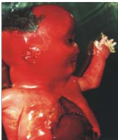
Figura 6. Implantación baja de oreja, piel redundante en nuca, nariz corta y macroglosia.

En 1943, Potter describió una entidad clínica que afectaba a embarazos sin sensibilización