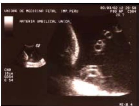
Figura 2. Presencia de arteria umbilical única con polihidramnios