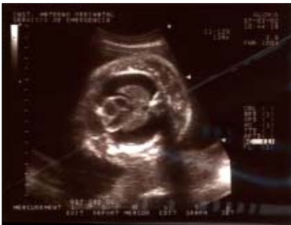
Figura 1. Muestra el gran hidrotórax con marcado compromiso pulmonar

La paciente reingresó al 6° día del procedimiento por ausencia de movimientos fetales, diagnosticándosele óbito fetal. El parto se produjo vía vaginal de manera electiva al día siguiente, con los hallazgos anatomopatológicos de feto macerado, talla 48 cm, perímetro cefálico 27,2, perímetro torácico 28,5 cm, perímetro abdominal 31cm, pie 6 cm, peso 2460 gramos, primer dedo separado del pie, implantación baja de oreja, boca ampliamente abierta con macroglosia, nariz corta, hipertelorismo, piel redundante en la nuca, hipoplasia pulmonar bilateral, severa anasarca; hallazgos compatibles con síndrome de Down (Figuras 5 y 6). El cariotipo (Figura 7) de sangre obtenida por cordocentesis, mediante técnica de bandedo