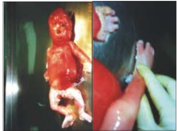
Figura 5. Hidrops fetal (derecha). Marcada separación del primer dedo (izquierda).

cromosómico GTG, confirmó una trisomía del par 21. La paciente fue dada de alta 2 días más tarde, previa consejería genética.