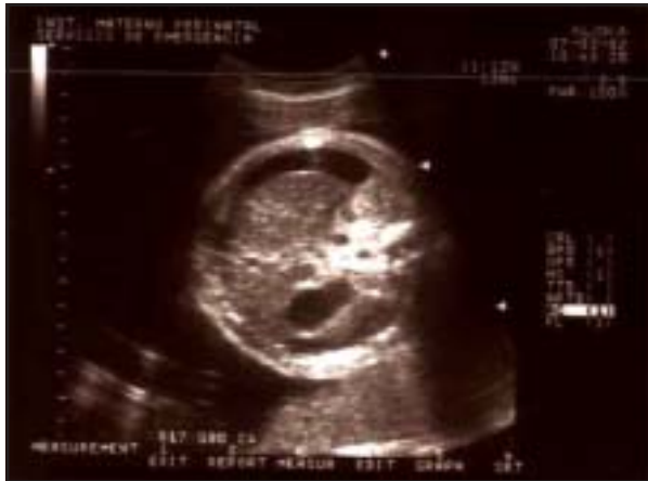
Figura 4. Marcada ascitis en un corte abdominal.