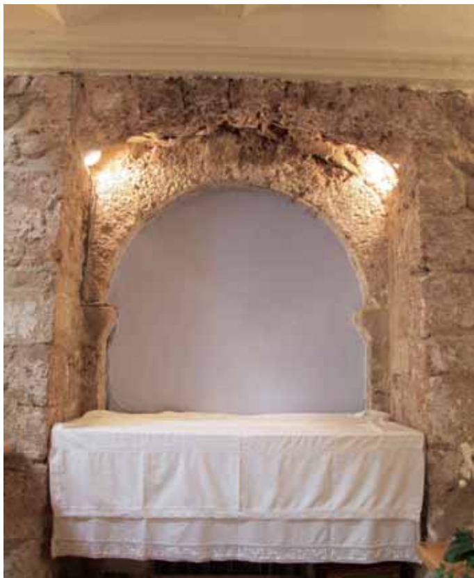
Puerta original de acceso a la iglesia

perfil muy rudimentario, sin decoración alguna, y el muro este, que tiene adosado un grueso contrafuerte, está rehecho en diversas zonas y presenta hiladas de ladrillo, alternadas con la fábrica de mampostería.