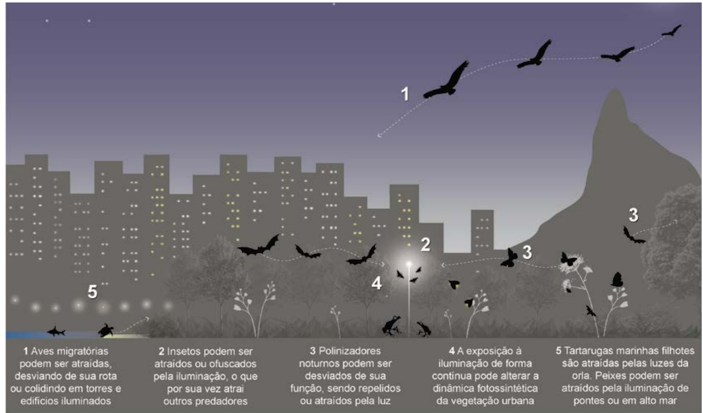
Figura 3: Dinâmicas da biodiversidade noturna em diferentes ecossistemas e sua relação com as luzes da cidade.

Quanto à vegetação, as plantas são organismos sensíveis que confiam nos sinais do ambiente para o seu desenvolvimento, principalmente através da luz natural.