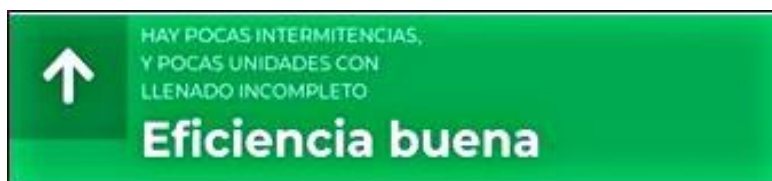
Figura 4. Alarma de eficiencia.

La función desarrollada en el lenguaje de programación R con la ayuda de la librería Shiny nos permite abrir una aplicación web, como se puede contemplar en la Figura 4, en la que podemos generar alarmas cuando la eficiencia que se predice supera algunos límites.