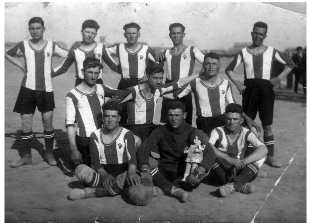
Fig 3. Equip de futbol de Linyola. Inicis dels anys 30.

A principis de 1926 sis jugadors trobaren feina fora de Linyola i deixaren l'equip que, encara que tingué algun triomf notable com el partit contra l'Almacelles per 2-1, va començar a perdre partits, i l'afició i la junta a discutir. Al mes de juliol, l'equip i junta s'havien desfet i el camp de futbol estava abandonat. 15