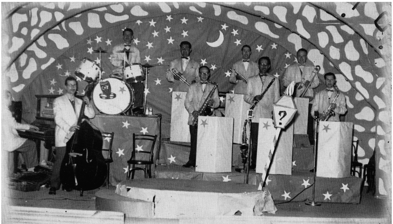
Club Trébol.