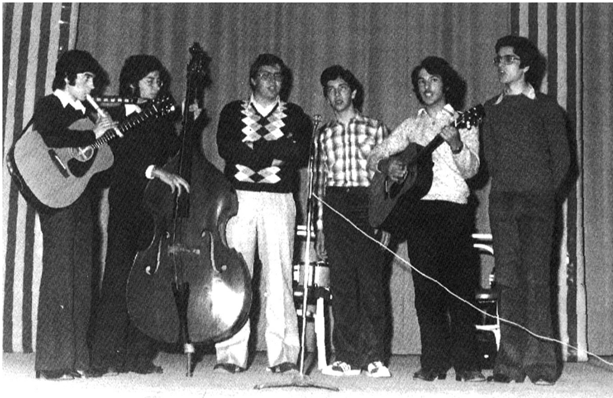
La Tarota (Font: Arxiu personal Antoni Civit).

Amb aquestes poques perspectives de futur, les úniques formacions seixanteres que van romandre en actiu als 70 foren Los Juvent's (la seva trajectòria s'allargaria fins a 1979), els PJ4, els Som Indígenes i Santy , qui actuaria fins a 1971 sota aquest sobrenom artístic. El relleu dins del pop melòdic l'agafarien Los Sugars i Made In Spain, dues bandes que seguien les petjades dels seus antecessors, però que no van adonar-se que les tendències musicals —com els temps— estaven canviant. Els qui sí van saber veure que els temps estaven canviant van ser un grup de joves que s'emmirallaven amb el folk americà i la Nova Cançó i dels quals en van sorgir La Tarota, Pam i Pipa, i Llum del Jordà, tres formacions molt heterogènies i que s'anirien superposant i mesclant al llarg dels anys. El punt de partida d'aquesta escena més d'arrel fou un concert de Llum del Jordà i La Tarota durant la festivitat de la Mare de Déu de Montserrat de l'any 1976 a Mollerussa. D'aquestes formacions folkies només sobreviuria La Tarota, i es veuria obligada a convertir-se en un grup d'animació ben entrats els 80 per no perdre pistonada.