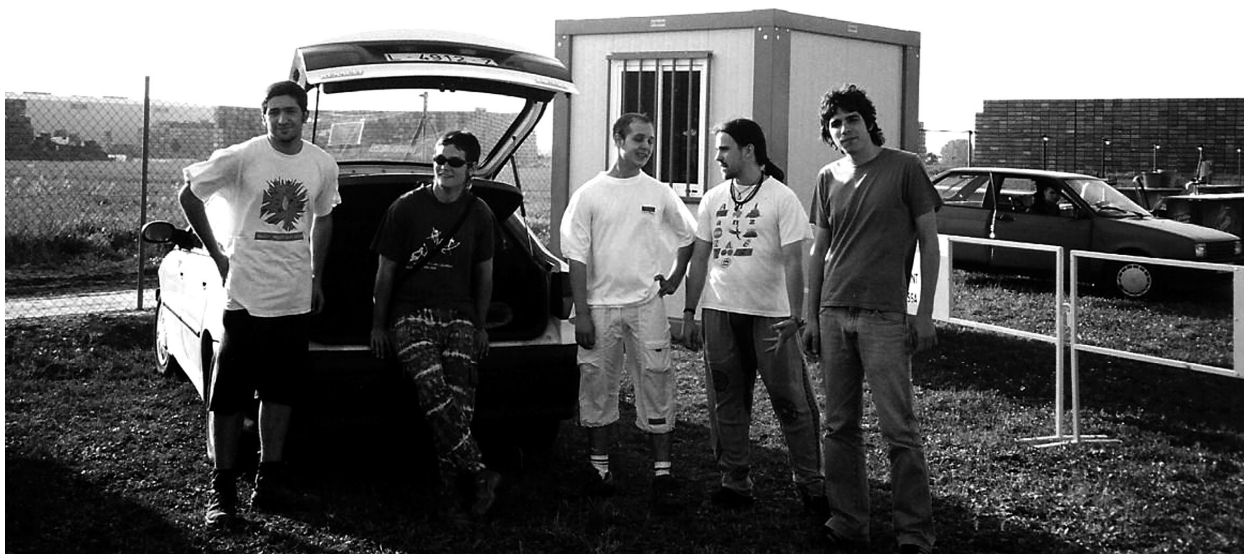
Sospirs d'un pagès (Font: Arxiu personal Oriol Bosch).

en festivals emergents i sales de renom. Ambdós projectes van acabar potser massa d'hora i abans que poguessin mitificar-se i agafar ja renom a escala nacional.