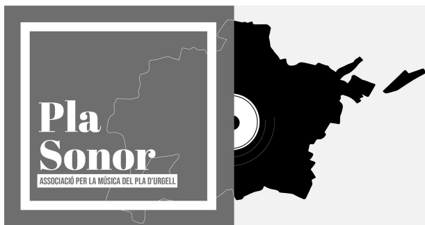
Pla Sonor.

El passat 2020 molts voldran esborrar-lo de la memòria, però a nivell musical el Pla d'Urgell va viure dos fets que poden marcar un abans i un després en tot el que s'ha explicat fins ara: la realització d'un macroconcert amb vint formacions comarcals en el marc d'una festa major de Mollerussa confinada i la constitució de Pla Sonor com a associació de músics i per a la música del Pla d'Urgell, després d'anteriors intents frustrats d'englobar tots els músics de la comarca en una entitat.