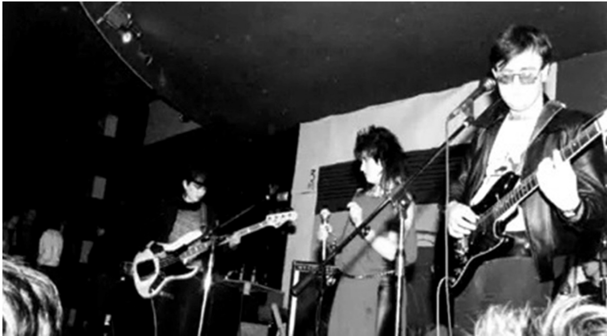
La Ostia Peluda y los Espermatozoides.