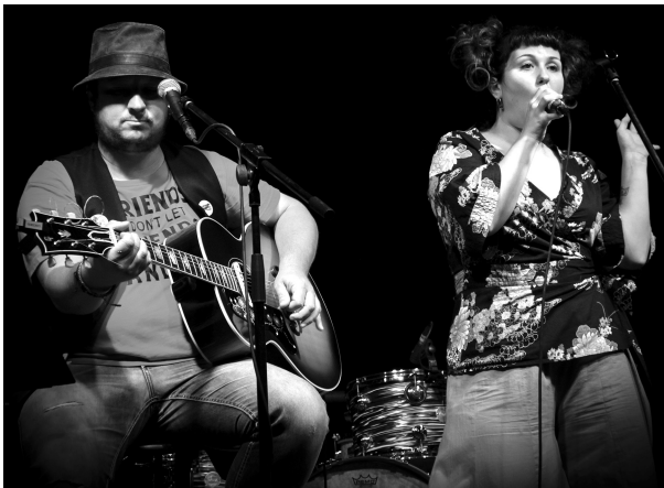
Walkin'Roots.