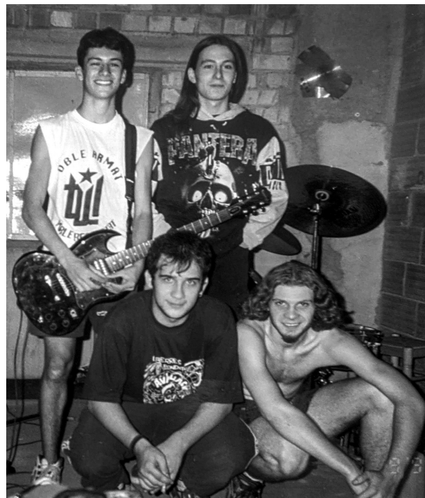
Crowd of Boars.

Al costat més soluble del punk van sortir els primers brots de metal . Des d'Arsenal —amb seu a Bellpuig però amb una forta presència del Pla— que van arribar a publicar tres maquetes amb tan sols quatre anys, fins als