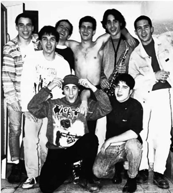
Mamuts.