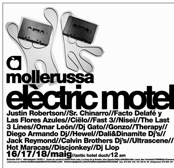
Mollerussa Elèctric Motel.

Els 2000 van suposar l'ordenació de les bandes i projectes locals, però també el sorgiment d'un seguit d'iniciatives i festivals que servien de contrapès a la desaparició de sales i clubs a la capital de la comarca. El Mollerussa Elèctric Hotel (anteriorment Cafè i posteriorment Motel), el Directe al Zel, el Padrí Rock, la versió local del Monsters of Rock, el MonaMour (no confondre amb la catastròfica reedició del 2018) o el Concert de l'Estelada foren alguns dels certàmens musicals que s'engegaren durant la dècada i que, per desgràcia, molts d'ells ja no existeixen avui dia.