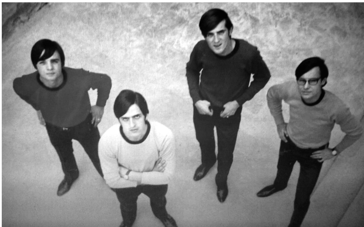
PJ4 (Font: Arxiu personal Ramon Pallás).

L'afany per imitar els Beatles no era casual i és que molts d'ells van adaptar la seva indumentària i el seu look