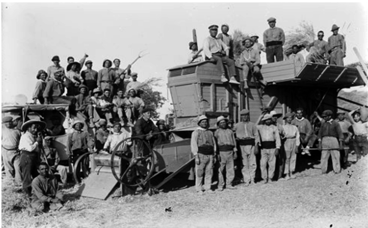
Imatge 2. Treballadors de la Societat del Canal d'Urgell. Principis del segle XX.