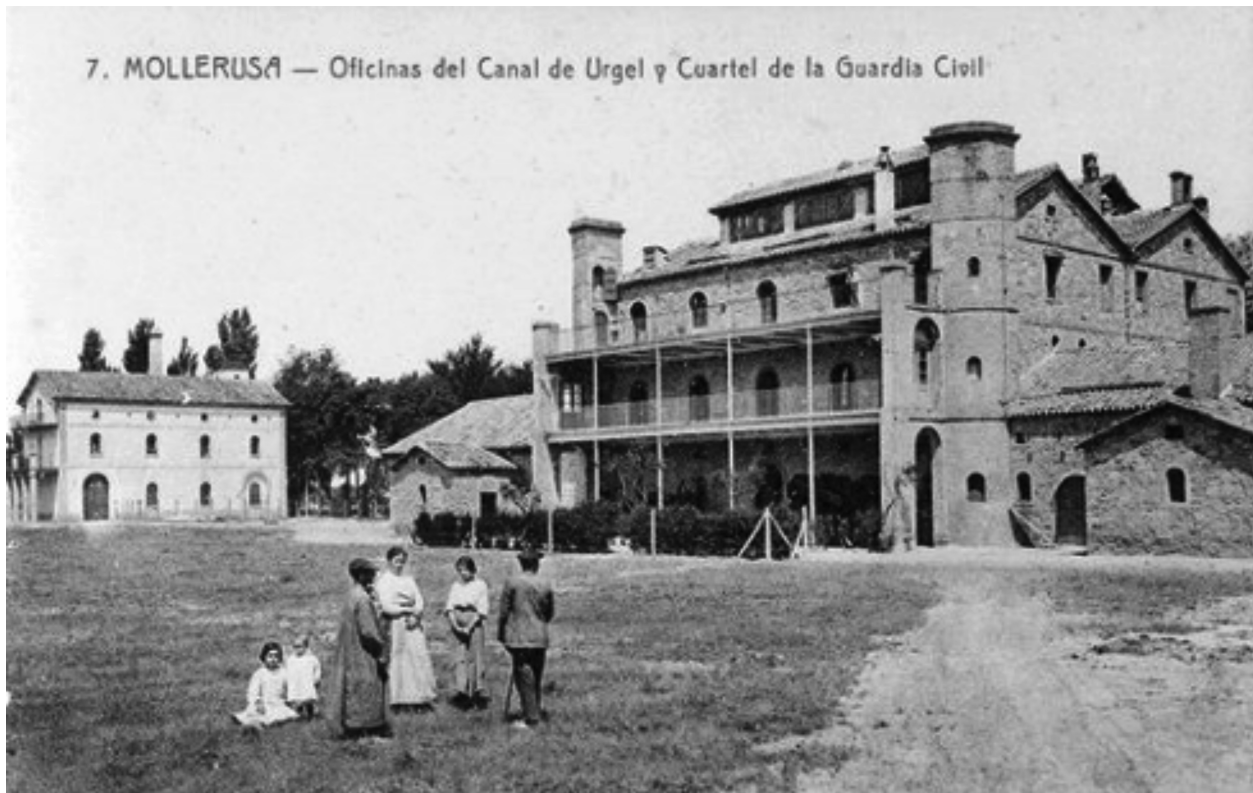
Imatge 1. La Casa Canal i la caserna de la Guàrdia Civil; primera dècada del segle XX.