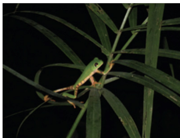
Figura N° 6. Corallus batesi y Calimedusa tomopterna