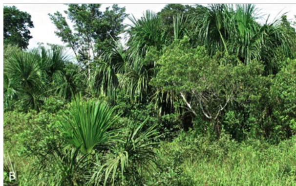
Figura N° 4. Hábitat típico de ACR Imiría, Moravec et al. ‘17

El estudio de Moravec (2) ubique sus puntos en el norte extremo de ACR Imiría en áreas debajo mucho presión por uso agrícola del paisaje. Mientras ninguna variación de cobertura de bosque estaba notado, este bosque se toca las orillas de la Laguna Imiría. Por eso las cifras de Moravec (2) representan un acercamiento para entender el sistema de humedales en Imiría—calificado como un sistema único en Ucayali. La diversidad en el género Osteocephalus implica la posibilidad del uso de la variedad de hábitats presentes en el sistema de este grupo muy complejo de ranas arbícolas (20, 21).