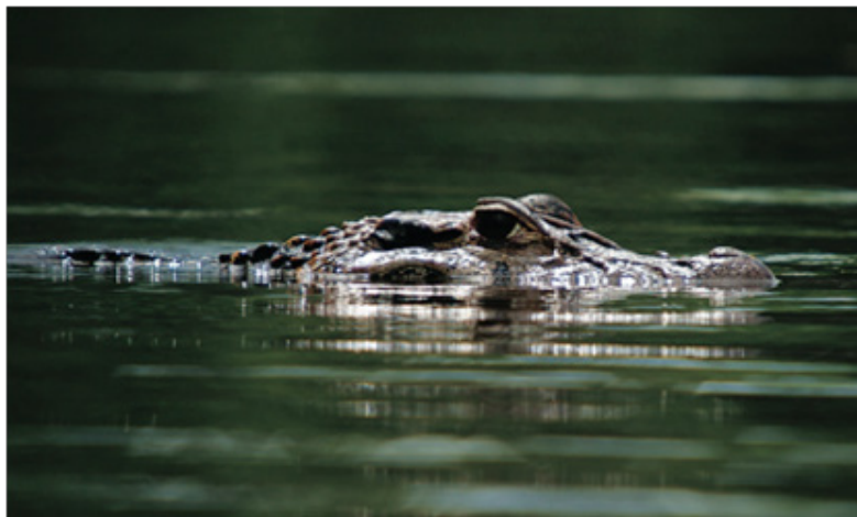
Figura N° 1. Caiman negro ( Melanosuchus niger )

A la fecha, hay 114 especies de anfibios y reptiles identificados en la cuenca Alto-Ucayali. En esta lista no aparece alguna especie categorizada en amenaza por la lista roja del IUCN; aunque el caimán negro ( Melanosuchus niger ) se encuentra en la lista de CITES como especies prohibida para comercializar.