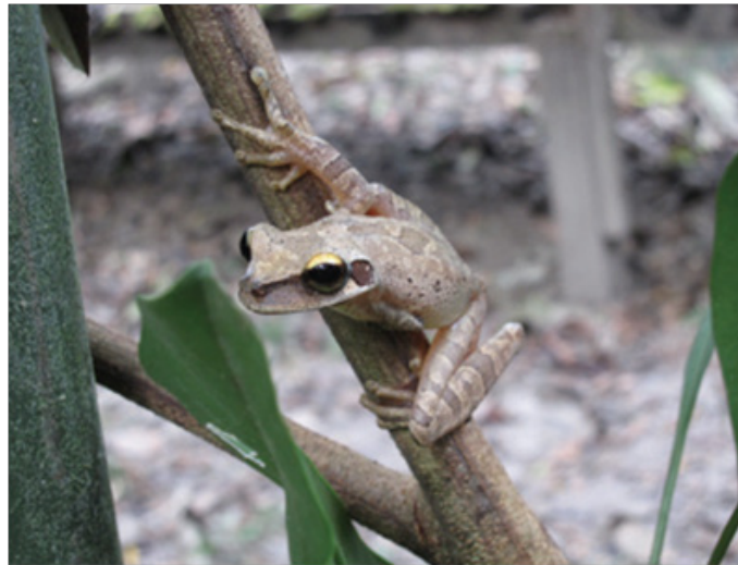
Figura N° 5. Osteocephalus castaenicola – parte del complejo sin registro en Ucayali