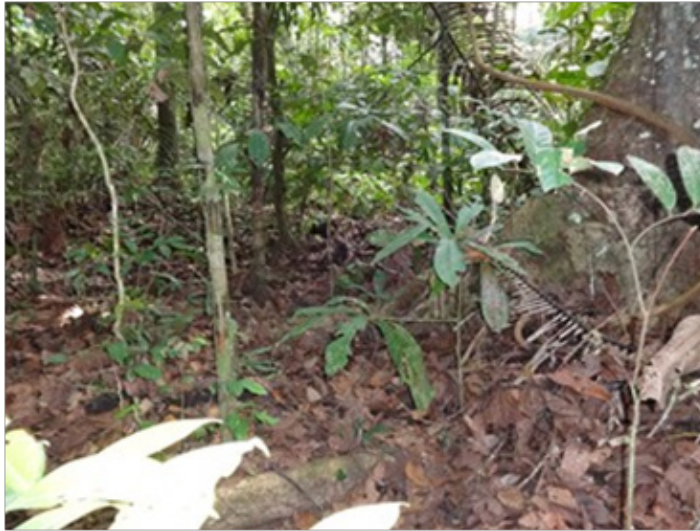
Figura N° 2. Bosque de San Mateo

Se ubica la Comunidad Nativa Santa Rosa de Tamaya Tipishca en las orillas del dicho cuerpo del agua, que esta afluente de los ríos Abujao y Tamaya. Se encuentra regularmente las zonas de bosque de inundación estacional de las llanuras meandricas o “tahuampas”. Este tipos de bosque normalmente es bajo en diversidad, pero los poblaciones de anfibios están mucho más productivas en cantidades (18, 19).