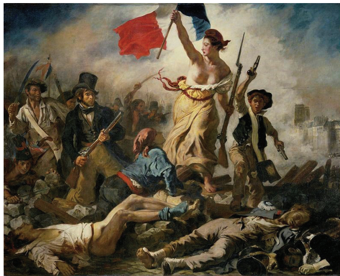
Figura 1. La libertad guiando al pueblo

Fuente: Eugène Delacroix, “ La libertad guiando al pueblo ”, 1830, óleo sobre lienzo, 260 x 325cm.