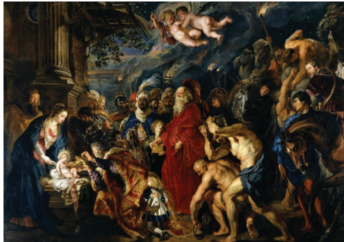
Figura 2. La adoración

Fuente: Pedro Pablo Rubens, “La adoración”, 1629, óleo sobre lienzo, 355,5 x 493 cm.