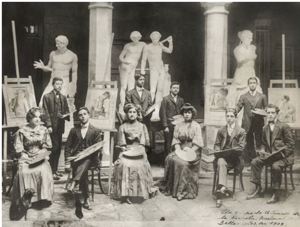
Figura 7. Alumnos de la Escuela de Bellas Artes de Quito

Fuente: Revista de la Escuela de Bellas Artes, no. 8, “Alumnos de la Escuela de Bellas Artes de Quito”, 1908.