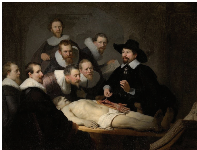
Figura 3. Lección de anatomía del Dr. Nicolaes Tulp

Fuente: Rembrandt, “Lección de anatomía del Dr. Nicolaes Tulp”, 1632, óleo sobre lienzo, 1,70 x 2,16 m.