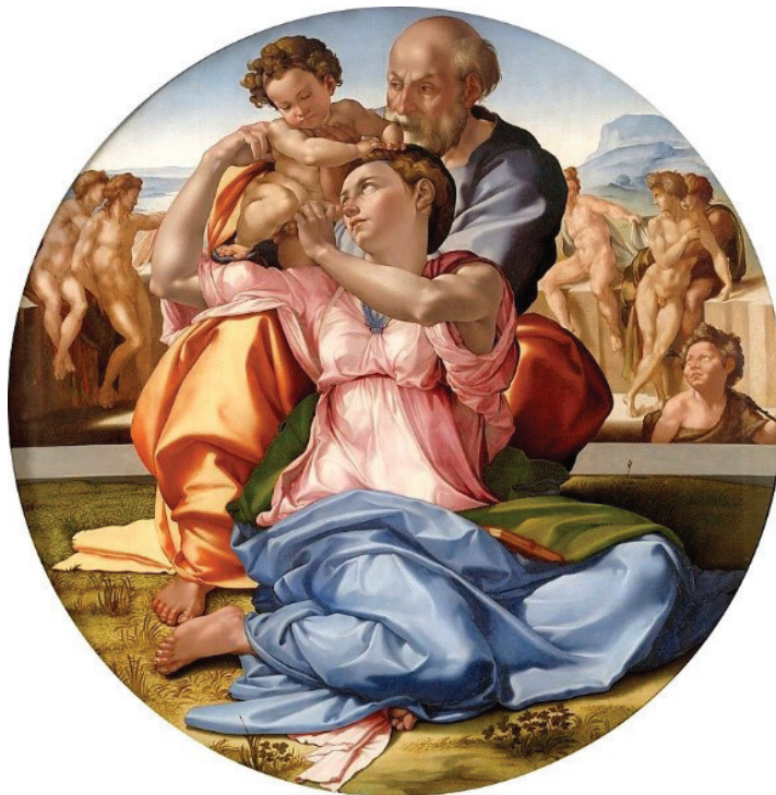
Figura 4. Sagrada familia

Fuente: Galería Uffizzi, "Sagrada Familia", 1506, óleo sobre lienzo, 120 x 120 cm.