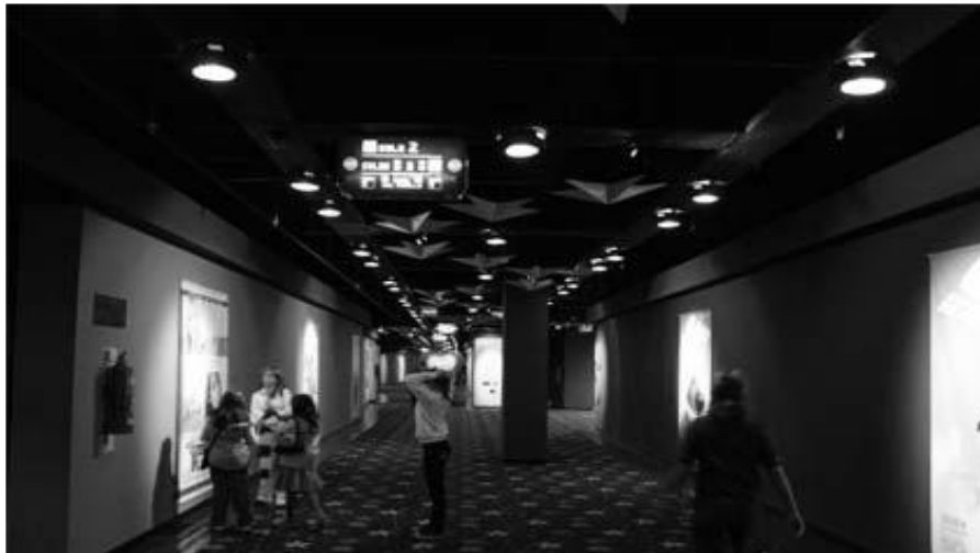
Figura 2 Pasillo de acceso