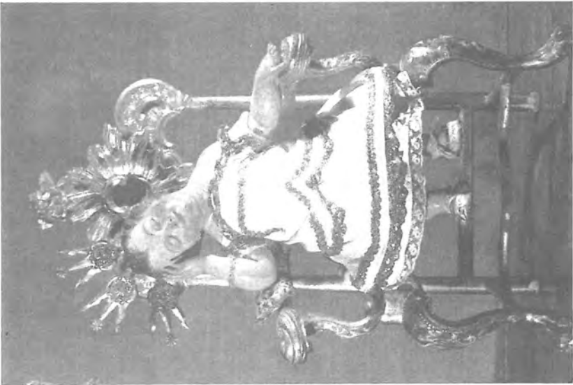
Fig. 3. Anónimo: "Niño Jesús pensativo", (s. XVIII). Museo Municipal. (Antequera).