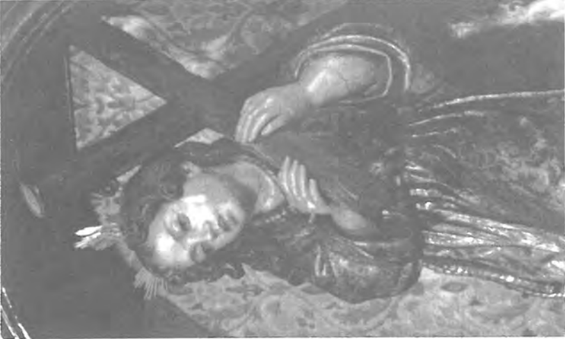
Fig. 4. Félix Granda Buyla: "Niño Jesús Nazareno", Casa-Hogar del Niño Jesús. (Málaga).