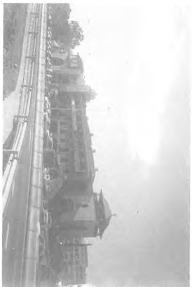
Fig.7. Centro Comercial El Zoco. Mijas-Costa.