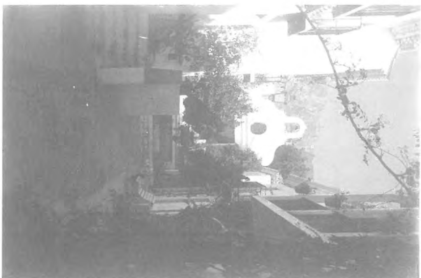
Fig.6. Urbanización La Virginia. Marbella.