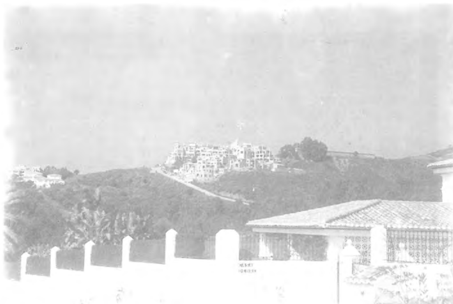
Fig.4.Urbanización Los Belvederes. Marbella.