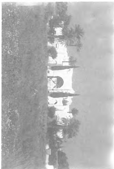
Fig.5. Palacio en Urbanización Villa Para. Marbella.