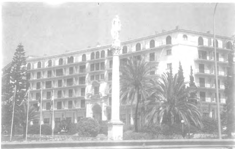
Fig.3.Hotel Andalucía Plaza. Marbella.