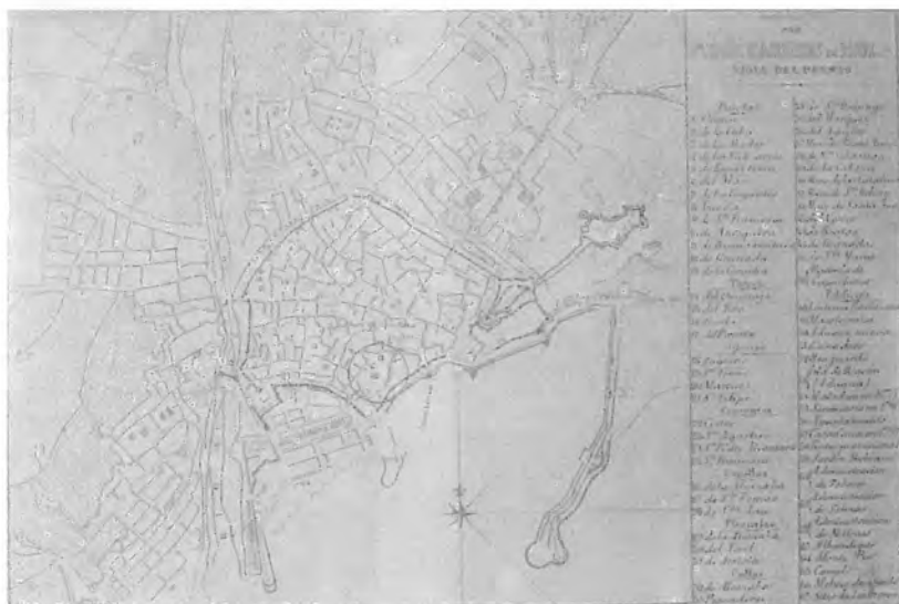
1. Situación del Hospital de la Caridad.