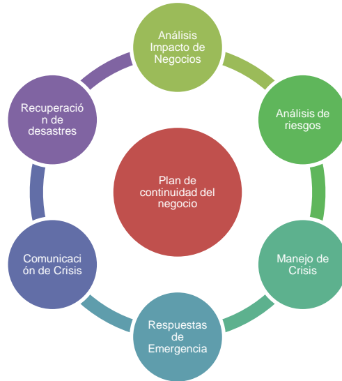
Figura 1. Plan de continuidad de negocios.

En estos tiempos de crisis se debe diseñar planes de continuidad en las empresas para asegurar su prolongación en el tiempo, según la firma Deloitte, al contar con este plan de continuidad se reduce de forma significativa el riesgo de quedar fuera del mercado luego de un desastre. Para este efecto se deben seguir los pasos que se muestran en la figura 1.