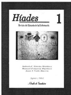
Figura 1.- Portada del número 1 de «Hiades. Revista de Historia de la Enfermería». Alcalá de Guadaíra, agosto de 1994.

formación de las enfermeras; por ese camino, con mayor ambición si cabe, hay que seguir trabajando en el futuro, sin bajar la guardia.