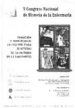
Figura 3.- Portada del programa científico del «V Congreso Nacional de Historia de la Enfermería». Sevilla, octubre de 2001.

V Congreso Nacional de Historia de la Enfermería Sevilla, 26-27 de octubre de 2001