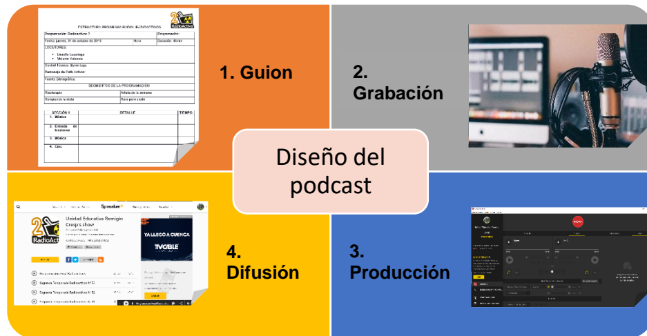
Figura 4. Pasos básicos para la realización de un podcast.