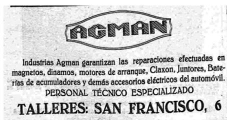
Anuncio en El Día de Palencia, 10 de abril de 1928.