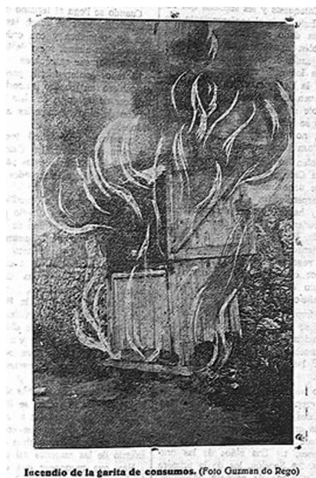
Incendio de la garita de consumos.

el de esta imagen, por muy rudimentario que nos pueda resultar visto con los ojos y las técnicas actuales.