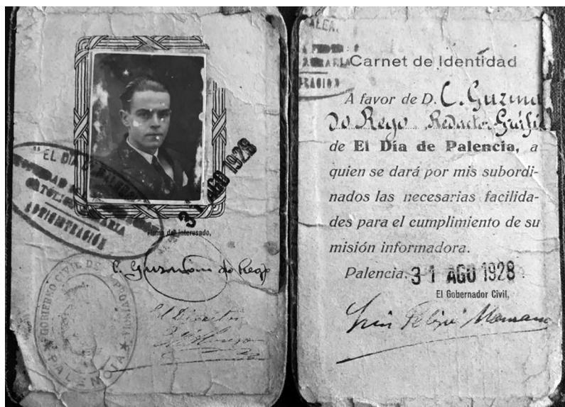
Carnet de periodista gráfico de El Día de Palencia .