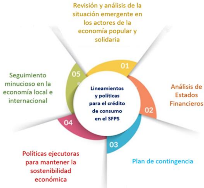
Figura 2: lineamientos y políticas para el crédito de consumo en el SEPS.