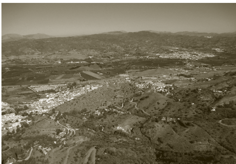
Lámina 4. Cartima y fortaleza andalusí desde Campo Viejo (J. M. a Álvarez)

2, n. 8) de cuello estrangulado, borde inclinado o exvasado.