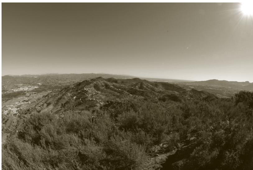
Lámina 3. Desembocadura del Guadalhorce desde Campo Viejo