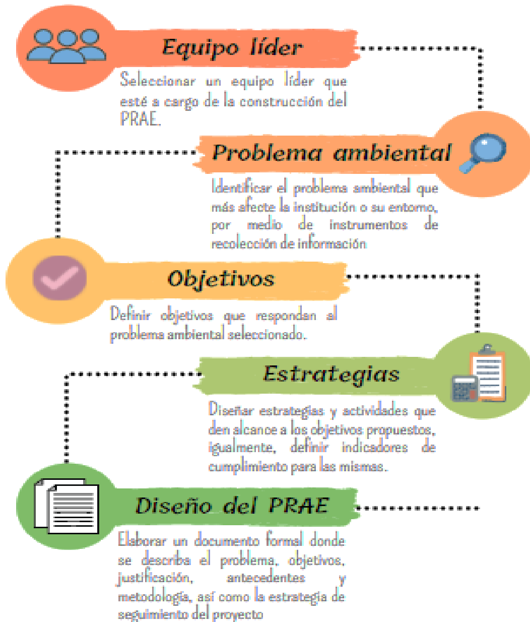
Figura 3. Ruta estructurada para la reconstrucción del PRAE. Elaboración: Los autores.