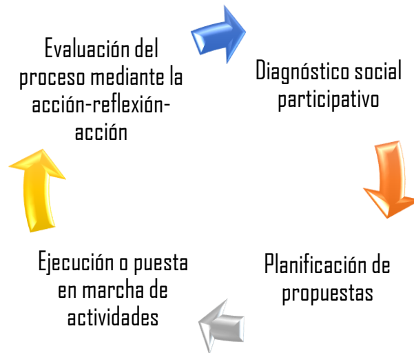
Figura 1. Fases de la IAT. Fuente: Ander-Egg (2003).

En cuanto al diseño del estudio, este se estructuró mediante las cuatro fases de la IAT acuñadas por Ander-Egg (2003) como: diagnóstico social participativo, planificación de propuesta para la resolución de problemas y toma de decisiones, puesta en marcha de las actividades planificadas y evaluación del proceso mediante la acción-reflexión-acción, acerca de lo que se está haciendo. Dichas fases se muestran a continuación: