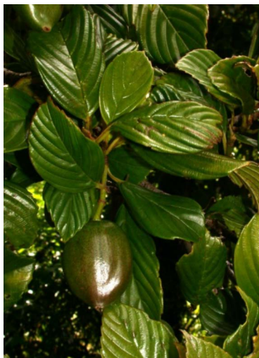
Figura 3. Ticodendron incognitum con frutos.