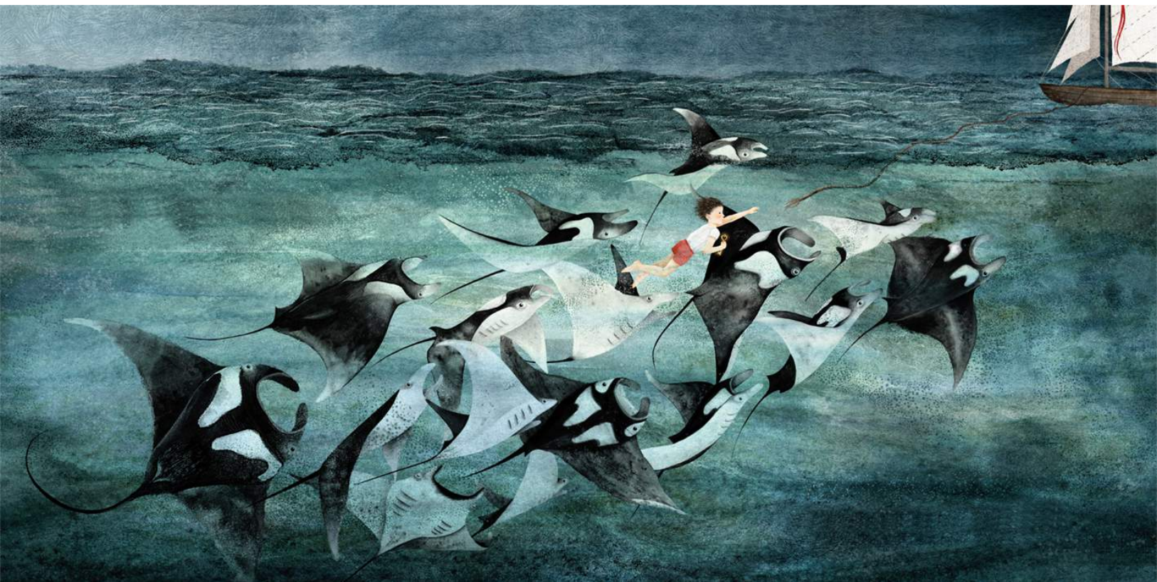
■ Navega , dibujo, 2021 | Autora: Dorien Brouwers. Tomado de: Pop Up UK

En este punto es necesario destacar que nosotros solo entrevistamos a verdaderos/buenos migrantes que hablaron, a veces, de falsos/malos migrantes. En esa medida, parece que dichas categorías describen una alteridad dentro del propio colectivo migrante que es crucial, puesto que los falsos/malos migrantes deterioran las percepciones locales sobre la totalidad de migrantes que transitan por pueblos y ciudades de México y dificultan el acceso a solidaridad, recursos y ayuda. Pero, además, es una alteridad que sirve como parámetro para