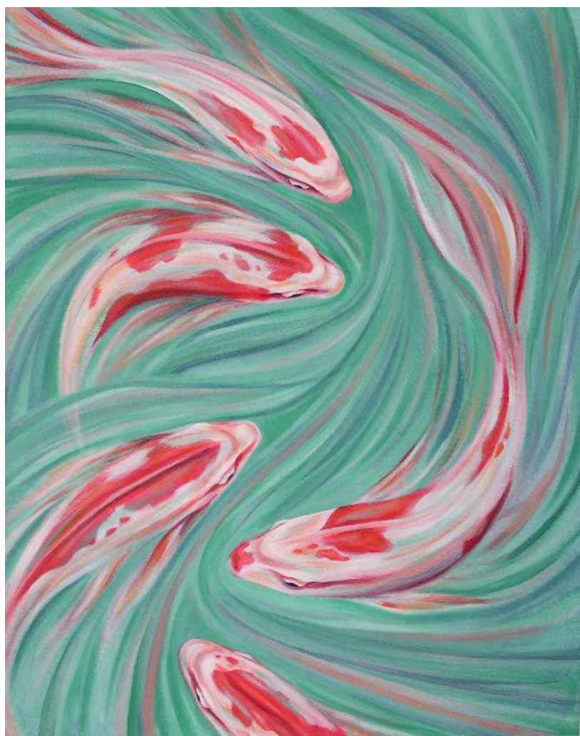
▪ Pez koi , acrílico en lienzo, 2008 | Autor: Edén Bachelder “Shmeeden”.

De acuerdo con la Red de Documentación de las Organizaciones Defensoras de Migrantes (Redodem), el grueso de la población que atiende “es una población varonil”, fundamentalmente joven (18 a 30 años), “con poca formación escolar, provenientes laboralmente del sector primario, esto es, de la agricultura y el trabajo jornalero” (2016, p. 75). Los rasgos mencionados coinciden con los datos de las Encuestas sobre Migración en las Fronteras de México (EMIF) realizadas del 2009 al 2018. Del total de las personas devueltas por autoridades mexicanas, el 55% tenía entre veinte y veintinueve años y el 82% eran hombres. Es importante aclarar que durante la práctica investigativa pudimos entrevistar mayoritariamente a varones jóvenes, por lo que la interpretación realizada corresponde a lo que dicho sector