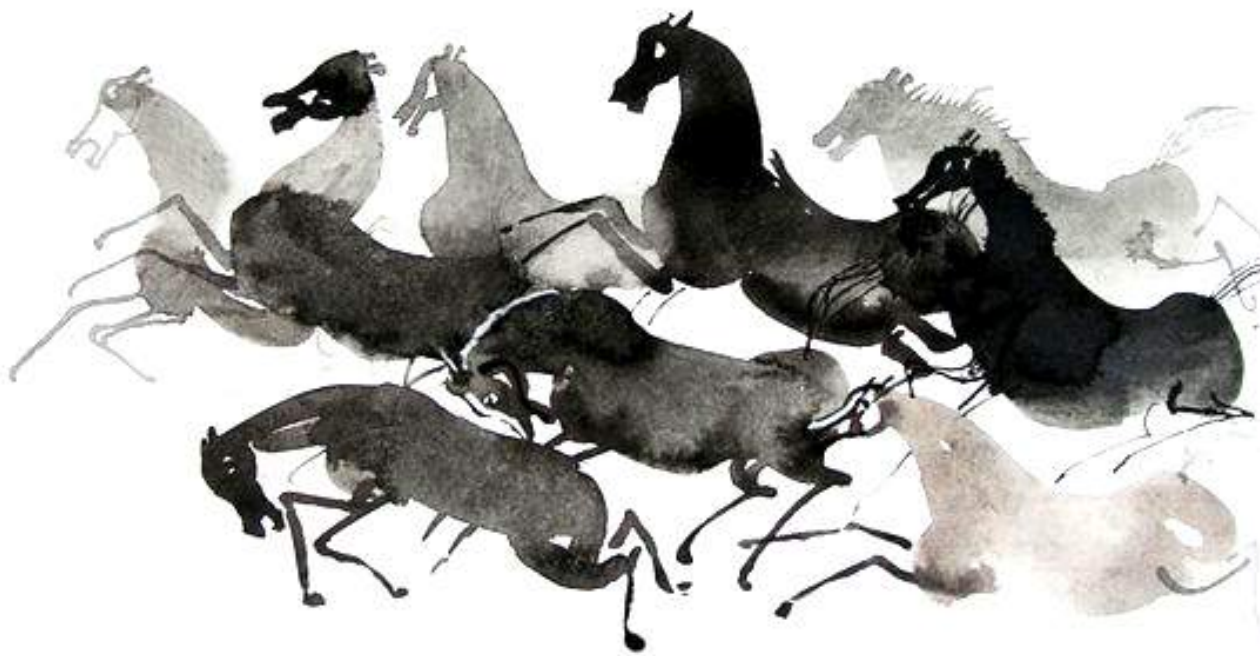
▪ Bestiarium Wilkonia - los caballos , pintura, 2009 | Autor: Józef Wilkon. Tomado de: The Animalarium Blogspot

La ética del trabajo construida por el colectivo migrante es producto del cruce entre dos condiciones: las experiencias de vida como personas autosuficientes que generan sus ingresos a partir del trabajo, y una relación con ellos mismos en la que se identifican como personas trabajadoras, que expresa, por tanto, su adhesión a una serie de valores, actitudes y modos de hacer. Ubicarse en estas prácticas cotidianas de sobrevivencia implica suspender ciertas nociones que se podrían tener sobre uno/a mismo/a: lo más importante es reemplazar temporalmente una consideración de sí sustentada en una ética del trabajo por otra de la necesidad y la petición. Por decirlo de manera esquemática, se deja de ser trabajador (aunque no completamente) para ser un necesitado, y se deja de vivir del trabajo para vivir de la caridad.