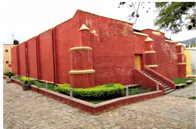
Figura 8. Presidio de Jalpan.

Es necesario enfatizar, en resumen, que los presidios formaron una frontera móvil en la marcha hacia el norte y que no necesariamente todos dieron lugar a la creación de asentamientos. Muchos de ellos, particularmente en la región central del virreinato, desaparecieron a los pocos años; otros, al establecerse cerca o junto a algún convento, permitieron que se establecieran grupos de indígenas o de españoles, y al paso del tiempo dieron lugar a la formación de algún pueblo. Debe quedar claro que mientras que casi la totalidad de los presidios desaparecen (Figura 8) —aun cuando permanezca algún asentamiento con el mismo nombre—, la gran mayoría de los conventos pervivirán, dando lugar a la creación de asentamientos de muy diversa importancia (véanse figuras 3, 4 y 5). Y respecto a los presidios septentrionales, fundados posteriormente, varios de ellos desaparecen al cambiar su ubicación y, si llegaron a tener algún asentamiento contiguo, igualmente desaparecen al ya no contar con la defensa de la tropa, lo que también afectaría, si fuera el caso, a misiones con las que compartían el territorio. Incluso los presidios del siglo XVIII llegan a vivir esa situación, aunque hay que decir que muchos de ellos sí sobrevivieron al cambio de régimen.