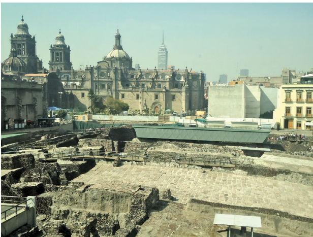
Figura 6. Ruinas del santuario indígena (primer plano), Catedral de México (segundo plano) y, al fondo, la Torre Latinoamericana. Tres tiempos de producción de la ciudad (precolombino, colonial y contemporáneo).

Instrumento político de dominio del territorio y de la población, la ciudad latinoamericana fue fundada formalmente; en el caso de Nueva España (Ciudad de México), fue construida en cuadrícula sobre la destruida Tenochtitlán, en 1521 (el santuario cristiano fue emplazado en el sitio que ocupaba el Templo Mayor y los edificios de culto indígena, Figura 6). La nueva ciudad fue la base de operaciones para la conquista del territorio, del norte de la América Central al sur y sudeste de los Estados Unidos (Hardoy 1996).