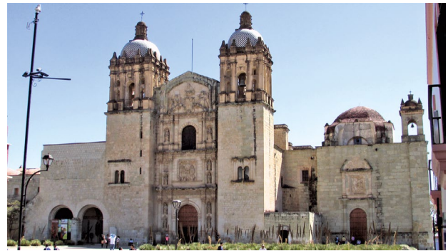
Figura 4. Convento Santo Domingo, Oaxaca, México. Fotografía de Costa, marzo de 2017.

El sometimiento armado de la población indígena era justificado, a los ojos del conquistador, para extracción de tributos y dominio del territorio, pero, sobre todo, para la salvación eterna del evangelizado y del propio evangelizador, considerando el barroquismo de la “cruzada” americana. Los mendicantes veían en la sociedad agraria (y urbana) ya constituida en el Nuevo Mundo terreno propicio para la misión; se sumaba el temperamento atribuido a los indios (“pobres, mansos, simples y humildes”, verdaderos apostólicos, “pacientes, sufridos sobremanera, mansos como ovejas”), pues una vez convertidos, “[se] acercaban a los sacramentos con tanta fe y constancia que daban ejemplo a los mismos españoles” (Rubial 2000, 120). Otra motivación era la estructura de abastecimiento y servicios que esa sociedad proveía a los conventos. Los frailes se oponían a los abusos de los encomenderos (pese a apoyar la institución), a los tributos excesivos y la esclavitud indígena; por otro lado, defendían obras de beneficencia como fundación de pueblos, cajas de comunidad, cofradías, hospitales, asilos y escuelas (Rubial 2000). Los conventos generaban una economía espacial (de subsistencia y excedente) atendida por el trabajo indígena voluntario.