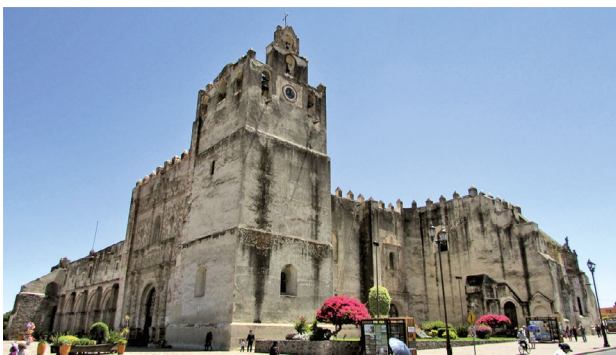
Figura 5. Convento-fortaleza agustino, Yuriria, Guanajuato, México. Fotografía de Costa, mayo de 2019.

En síntesis, la ocupación del territorio por parte de los españoles ocurrió gracias al establecimiento de conventos (también presidios, reales de minas, pueblos de indios y haciendas), los cuales, en muchos casos, dieron lugar a asentamientos permanentes (aunque su finalidad no fuera esa). Pero la ocupación debe ser diferenciada en función del territorio tratado. Mientras en la región central y sur (Mesoamérica) la ocupación se dio aprovechando la existencia de los numerosos asentamientos indígenas, generando una sobreposición, en el norte, los establecimientos (conventos, presidios, etc.) se construyeron desde cero y, sobre todo, con la oposición de los grupos indígenas. Así, numerosos conventos se crearon en asentamientos previamente establecidos, si bien, la fundación de un convento o un presidio no necesariamente resultó en la creación de un asentamiento.