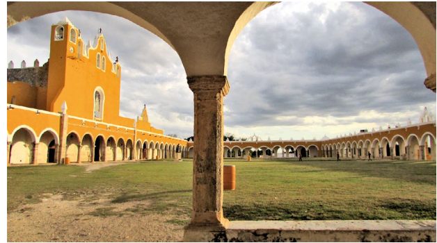
Figura 3. Convento franciscano de San Antonio de Padua, Izamal, Yucatán, México. enero de 2018.