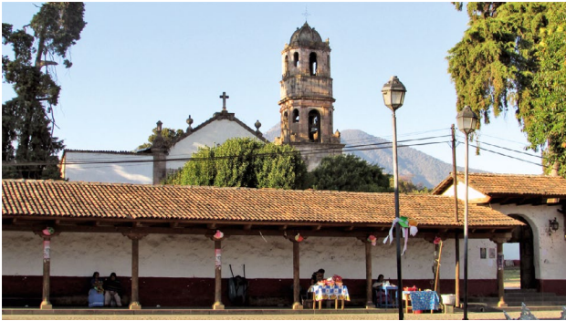
Figura 9. Santa Fe, pueblo de indios que preserva la espacialidad de la antigua reducción. Fotografía de Costa, abril de 2019.

Al interior de la práctica conscientemente condicionante de “ciudades de blancos” y “pueblos de indios”, se generó un apartheid 22 favorable a una paradoja espacial en América Latina. De esa segregación originaria emergió la sobrevivencia de numerosas comunidades indígenas, hasta la contemporaneidad; son comunidades en las que el mestizaje cultural pervirtió el carácter dominante hispánico y garantizó la integración de elementos indígenas con los europeos, una estrategia original decolonial de ir más allá de la dicotomía subyugo/desobediencia. Un caso similar a ese apartheid ocurrió en la más tardía urbanización colonial brasileña, la cual antagonizó a los blancos de los “sobrados”, bien localizados, con los negros, caboclos y pardos libres de los “mocambos” de áreas de inundación; esa segregación espacial originaria no fue solo morfológica, pues su contenido político-patriarcal empeoró las condiciones de vida de negros libres y mestizos pobres en las ciudades, persistente en el país hasta hoy. 23 Esta segregación representa violencias, miseria y muertes, generadas en el condicionamiento territorial catalizado no solo por la concepción occidental del trabajo de sumisión, sino también en defensa de una estetización barroca del control, por la pompa, la algarabía, el resplandor, lo ceremonial, lo ritual, lo fáustico —una simultaneidad constituyente de la modernización transescalar y transtemporal euro-latinoamericana—.