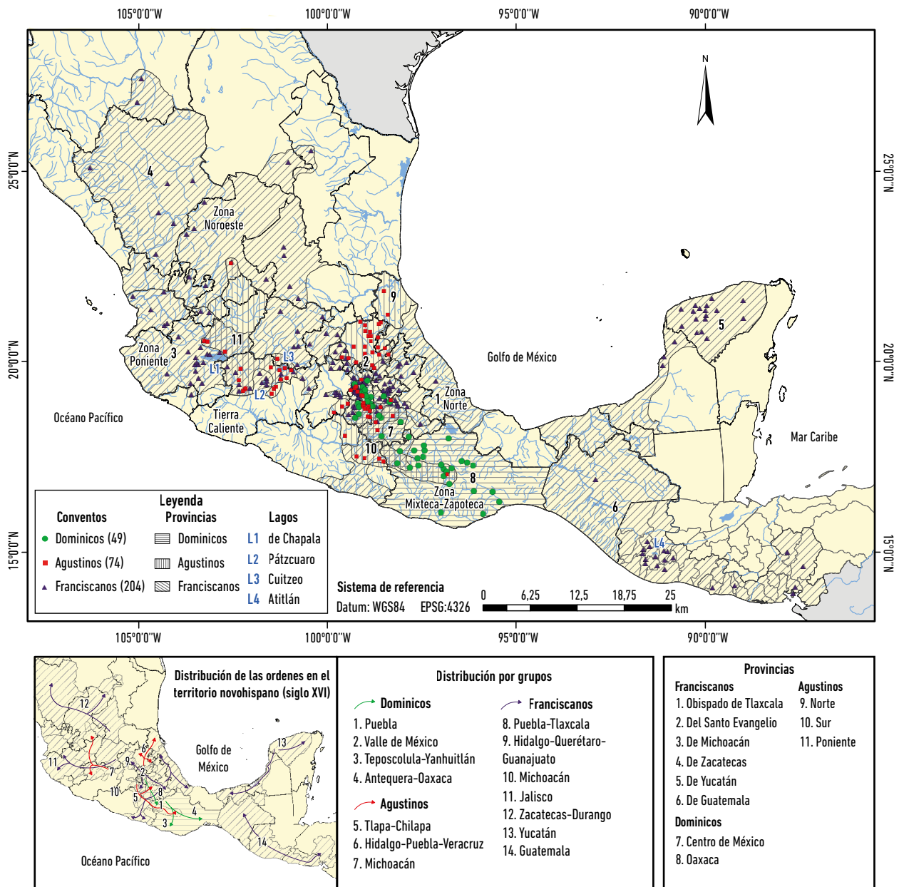
Figura 1. Condicionamiento barroco del territorio (conventos siglo XVI).