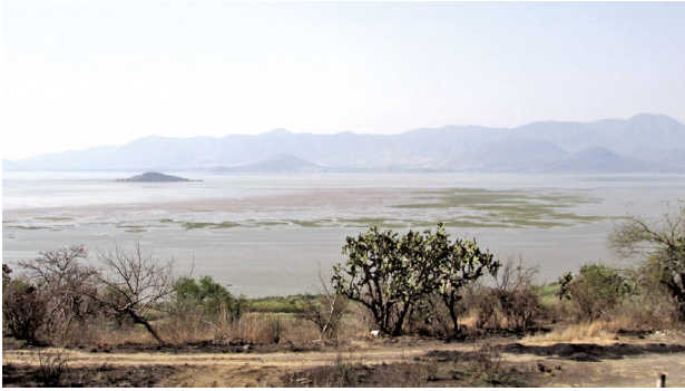
Figura 2. Lago de Cuitzeo, Michoacán, un referente de la distribución de los conventos mendicantes en Nueva España en el siglo XVI. Fotografía de Costa, mayo de 2019. 13

y las pequeñas cuencas de Sayula, Cuitzeo y Pátzcuaro” (Vázquez Vázquez 1965, 46). La mayor expansión de los dominicos ocurrió en Oaxaca, al evangelizar los valles de Teposcolula y Yanhuitlán en la Mixteca (Eje Volcánico entre Sierra Madre Oriental y Sierra Madre del Sur) y en la zona Zapoteca.