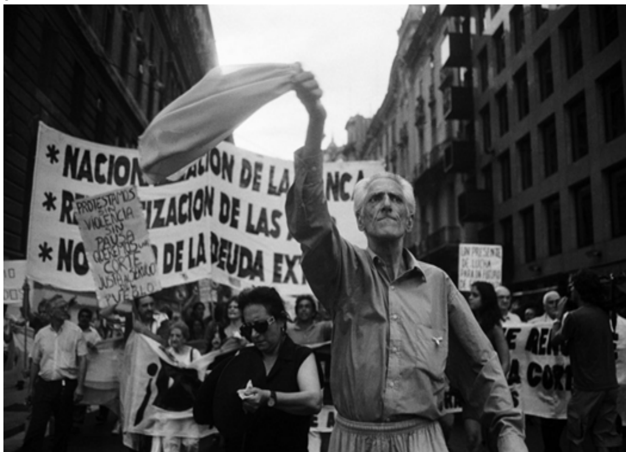
Figura 1. Buenos Aires, Diciembre 2001