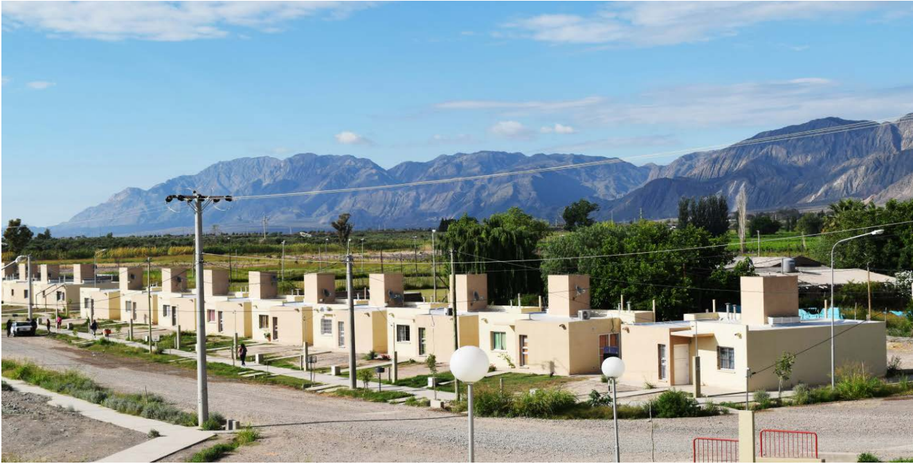
Figura 2. Barrio con vivienda social en la periferia urbana de la Ciudad de San Juan

Barrio Rivadavia-Conjunto 8. San Juan. Marzo 2020.