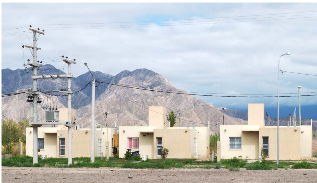
Figura 1. Vivienda Social en la periferia de la Ciudad de San Juan

Fuente: Archivo personal. Barrio Rivadavia-Conjunto 8. San Juan. Marzo/2020