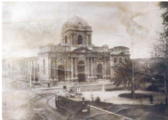
Figura 4. Vieja Catedral de Chillán, destruida en el terremoto de 1939.

En las figuras 4 y 5, se incluye un ejemplo de una estructura que fuera destruida por el terremoto y que debiera ser reconstruida: la Catedral de Chillán.