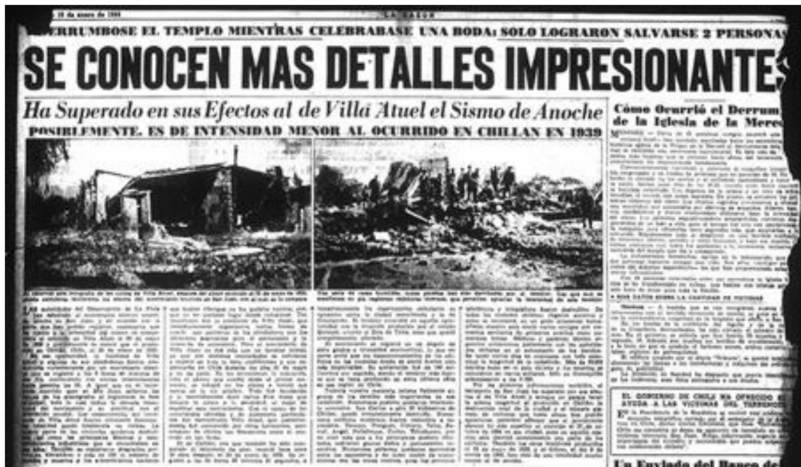
Figura 2. Se conocen más detalles impresionantes. (1944, 18 de enero). Diario La Razón .

magnitud), su destrucción material fue total, con más 30.000 muertos. Las noticias periodísticas desde Chillán retrataron el desastre y presentaron imágenes aterradoras (véase figura 2).