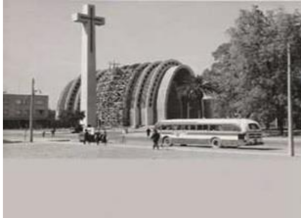
Figura 5. Nueva Catedral de Chillán, se observa la cruz que se erigió como homenaje de los que perecieron en el terremoto de 1939.

A continuación, veremos lo que sucedió en el país colindante, Argentina, unos años después, al producirse un episodio de similares características.