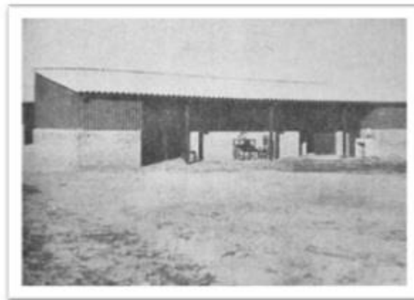
Figura 6. Modelo tipo de vivienda de emergencia.

En la figura 6, se agrega una fotografía para ejemplificar el modelo-tipo de una vivienda de emergencia. En este caso, contaba con 4 habitaciones, baño y cocina.