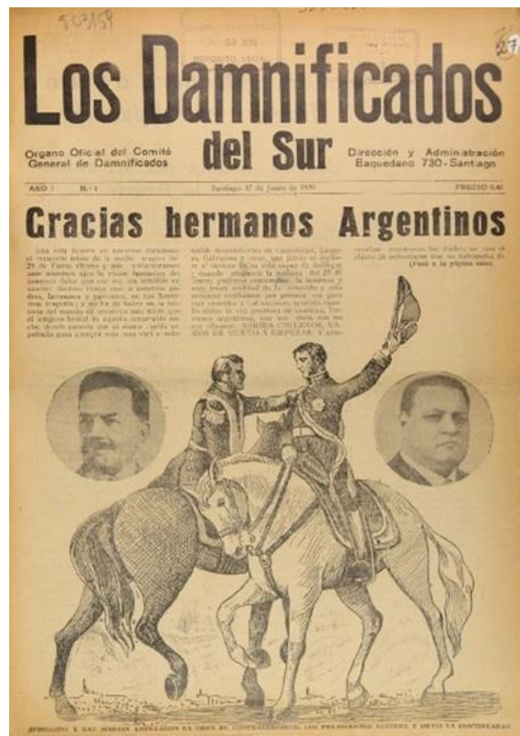
Figura 3. Gracias hermanos Argentinos. (1939, 17 de junio). Los Damnificados del Sur .

Fue en este episodio tan triste para una comunidad tan castigada como la de Chillán, en el que Argentina prestó su intensa colaboración así lo refleja el diario emitido por el Órgano Oficial del Comité General de Damnificados de Santiago. La imagen de portada impresionantemente representativa “O’Higgins y San Martín” junto a los dos presidentes del período “Aguirre y Ortiz” (figura 3).