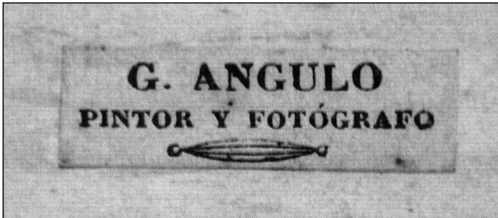
Dorso de fotografías de Galo Angulo Romo

A pesar de la proliferación de anuncios, la vida de este fotógrafo nacido en Madrid fue corta. Falleció en 1870 a los 41 años en su domicilio de la calle Concepción nº 6, a la 1 de la noche y según certifica el médico, a causa de “neurisma al corazón”. Se llamaba Galo Angulo y Romo , 5 era soltero y sus padres, ya difuntos, eran Dionisio y Antonia.