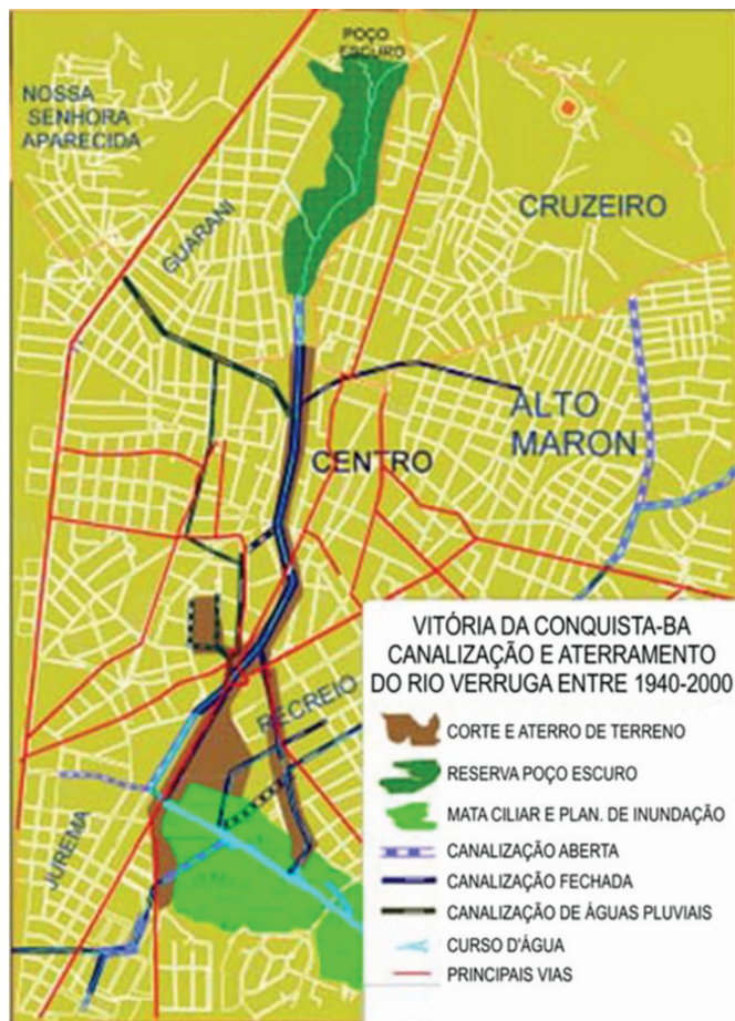
Mapa 3. Canalização e aterramento do rio Verruga