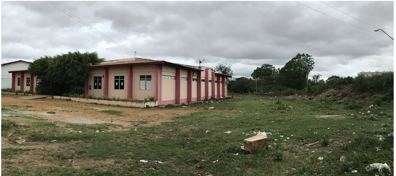
Imagem 2. Biblioteca municipal inserida na área do Aguão