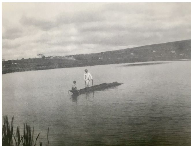
Imagem 1. Açude de Vitória da Conquista