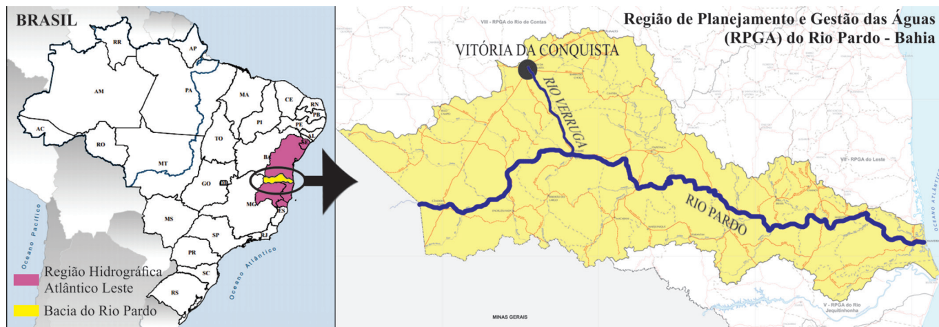
Mapa 1. Localização de Vitória da Conquista e do rio Verruga na Bacia do Rio Pardo e no Brasil