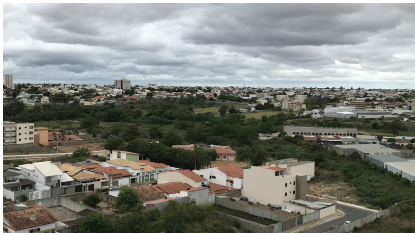
Imagem 3. Área remanescente do Aguão