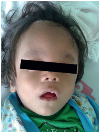
Figura 1. Se observa macrocefalia con perímetro cefálico de 55 cm, frente prominente con áreas de alopecia, asimetría facial e hipertelorismo ocular.

Actualmente presenta al examen físico peso 15.4 kg (P50), talla 73 cm (<P3), frecuencia respiratoria 24, frecuencia cardíaca 130, temperatura 36.8°C, perímetro cefálico 55 cm. Paciente hipotrófico, macrocéfalo de frente amplia abombada, exoftalmos, hipertelorismo ocular, nistagmo, ausencia de piezas dentales, orificios nasales estrechos, hipertrofia adenoidea, palidez en mucosas y piel. (Figura 1). A la auscultación del tórax se aprecian ruidos nasales transmitidos, campos pulmonares ventilados, ruidos cardíacos rítmicos no ruidos agregados. A la palpación del abdomen, hepatomegalia leve. Extremidades asimétricas hipotróficas, equino valgo bilateral y genitales normales.