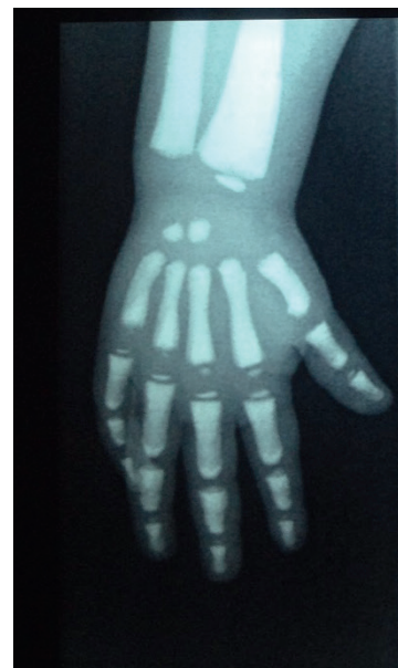
Figura 4. Imagen de hueso dentro de hueso en mano derecha