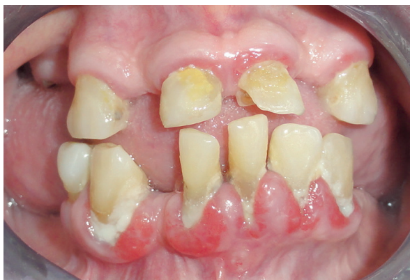
Figura 1. Agrandamiento gingival en paciente hipertenso tomando Amlodipina.

La terapia medicamentosa en pacientes hipertensos es recomendada con una presión arterial mayor o igual a 140/90 mmHg. Es importante que un paciente hipertenso se encuentre controlado siempre, ya que esto confiere una reducción de hasta el 40% del riesgo de sufrir un accidente cerebrovascular y de un 16% de sufrir enfermedades cardíacas en los 5 años siguientes al tratamiento. Además reduce hasta un 50% el riesgo de insuficiencia cardíaca. 1 Actualmente no se ha establecido en nuestro medio la relación entre el uso de fármacos anti-hipertensivos con la patogenia de las manifestaciones orales descritas