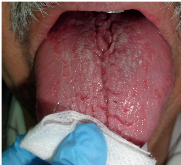
Figura 2. Lengua fisurada a causa de hiposalivación en paciente hipertenso.

Los fármacos utilizados pertenecen al grupo de los diuréticos, beta bloqueantes, simpaticolíticos, alfa antagonistas y los antagonistas de los canales de calcio. 1 y su uso puede causar manifestaciones orales tales como xerostomía, disgeusia, hiperplasia gingival, reacciones liquenoides, entre otras como efecto secundario.