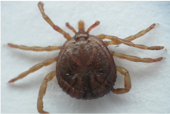
Figure 1. Amblyomma cajennense sensu lato (male) collected in Montería, department of Córdoba.

Another vector involved in the transmission of rickettsia commonly found in Colombia is Rhipicephalus sanguineus , or brown dog tick (Figure 2).