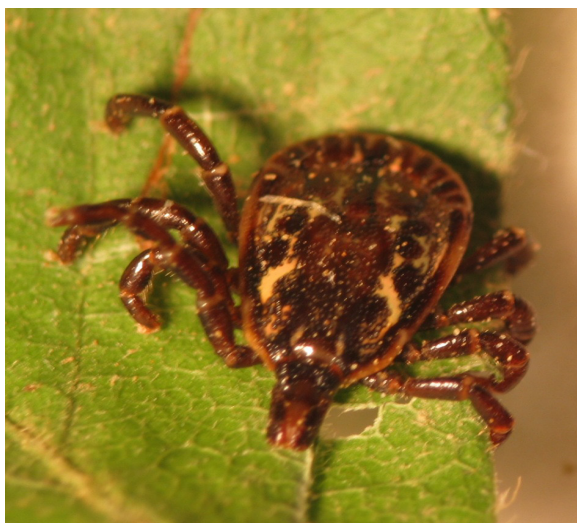
Figure 3. Amblyomma ovale (male) collected in the municipality of Los Córdoba, department of Córdoba.

since it belongs to the SFG group, characterized by having most of its species as pathogenic for humans. Another reason to consider Candidatus Rickettsia sp., Colombianensi strain as potentially pathogenic, is that it has a 99% genetic identity with Rickettsia tamurae , a species of the GFM group, and associated to human disease. This species is reported mainly in Japan in Amblyomma testudinarium (15, 16). However, vigilance of human rickettsiosis cases in the areas where this new species was described would be the best way to establish its pathogenicity.