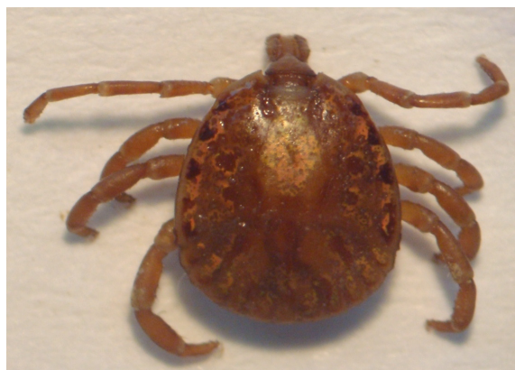
Figure 4. Amblyomma dissimile (male) collected in the municipality of Montería, department of Córdoba.

Pathogenesis. Pathogenesis for all rickettsias is similar; molecular characteristics and gene expression contribute to the pathogenicity among different species of rickettsia. Rickettsiae expresses two major surface proteins called external membrane protein A (rOmpA) and B (rOmpB), both present in SFG rickettsias but rOmpB is found only in rickettsias of the GT group. They play an important role in cell adhesion and therefore are considered in the potential development of vaccines (17, 18). Studies performed on R. conorii demonstrated that the adhesion of rOmpB to Ku70 (receptor) and RickA protein result in a recruitment of the protein complex Arp2/3 (Arp: actin-related protein) which controls actin polymerization, resulting in rickettsia phagocytosis (19-21). Once inside the cytoplasm, rickettsia escapes from the phagocytic vacuole and enters the cytoplasm. The proteins involved in the liberation are phospholipases and hemolysins, phospholipase D (PLD) and others such as the B1 patatine precursor coded by the pat1 gene, and two hemolysins coded by genes tlyA and tlyC (22-24).