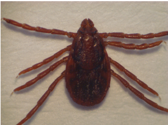
Figure 2. Rhipicephalus sanguineus (female) collected in Montería, department of Córdoba.

Another vector involved in the transmission of rickettsia commonly found in Colombia is Rhipicephalus sanguineus , or brown dog tick (Figure 2).