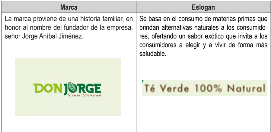
Tabla 6 Marca y eslogan