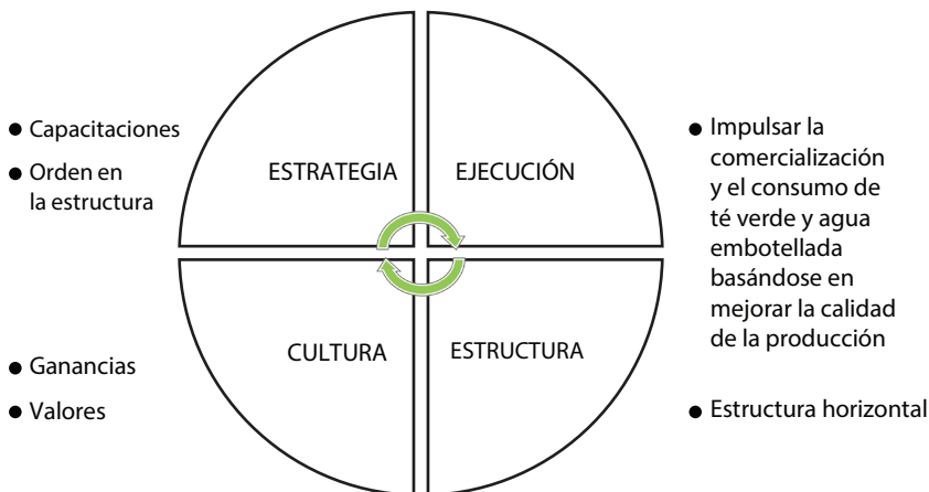
Figura 2 Modelo de gestión

Se toma en cuenta el concepto de Osterwalder, Pigneur y Tuccini (2005), que define que un modelo de negocio es una herramienta conceptual que contiene un conjunto de elementos y sus relaciones y que nos permite expresar la lógica de negocio de una empresa específica. La estructura del modelo de gestión de la empresa se enfoca en 4 aspectos fundamentales: estrategia, ejecución, estructura y cultura, que nos permiten ejecutar las estrategias definidas.